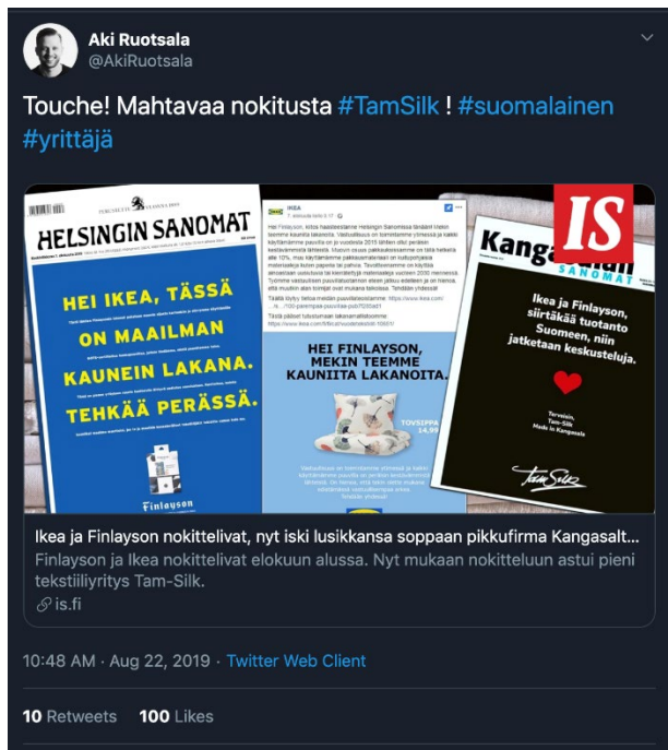
Kuva 1. Twitter-kansa ihastui Tam-Silkin oivaltavaan vastuullisuusviestintään (Twitter 2019)

Tapaus Tam-Silk ei ole ainoastaan malliesimerkki modernista markkinointiviestinnästä, mutta myös vaikuttavasta vastuullisuusviestinnästä. Kaikki alkoi Finlaysonin Helsingin Sanomien etusivun mainoksesta 7.8.2019, jossa todettiin: