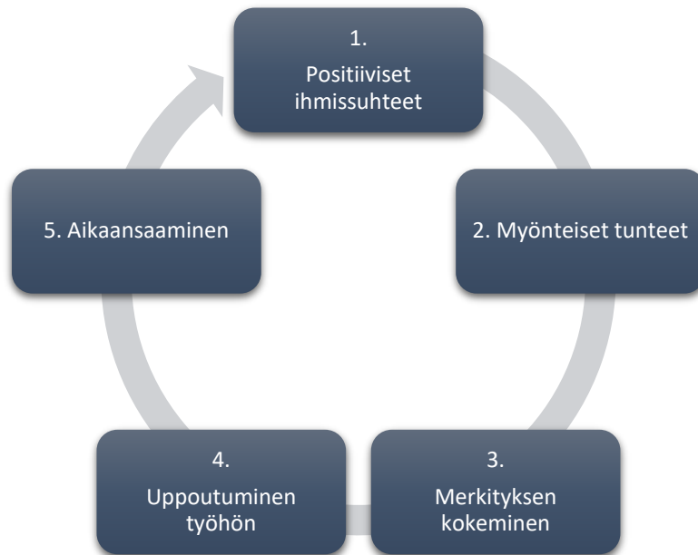
Kuvio 3. Kukoistavan opettajuuden kehä.

Kukoistavan opettajuuden kehämallille ominaista on se, että sen osatekijät vaikuttavat toinen toisiinsa. Toinen kehämallia määrittävä ominaisuus on se, ettei se toteudu hetkessä, vaan se on pidemmän ajanjakson ja useamman yksittäisen tapahtuman ja tilanteet summa.