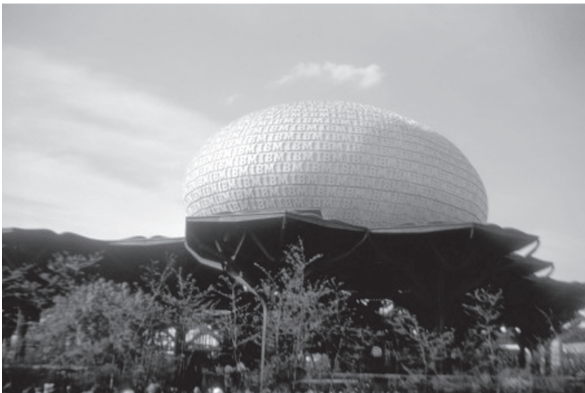
Pavillon IBM de l'Exposition universelle de 1964 à New York