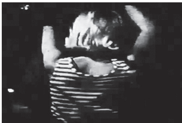
Exploding Plastic Inevitable (Ronald Nameth, États-Unis, 1967)

ainsi leurs effets de choc et de distraction afin de produire l'équivalent tridimensionnel et multimédia du moiré. C'est bien ce que décrit le critique Larry McCombs, qui avait remarqué de quelle manière « les lumières [...] deviennent faibles, bleues et scintillantes, un scintillement qui s'accélère, se ralentit ou s'arrête ici et là, au moment où vos yeux s'accoutument au scintillement », et comment « tout à coup le rythme de la musique, les mouvements des différents films, la pause des danseurs, se mélangent en un ensemble signifiant, mais avant que votre esprit ne puisse le saisir, celui-ci redevient aléatoire et déroutant » 47 .