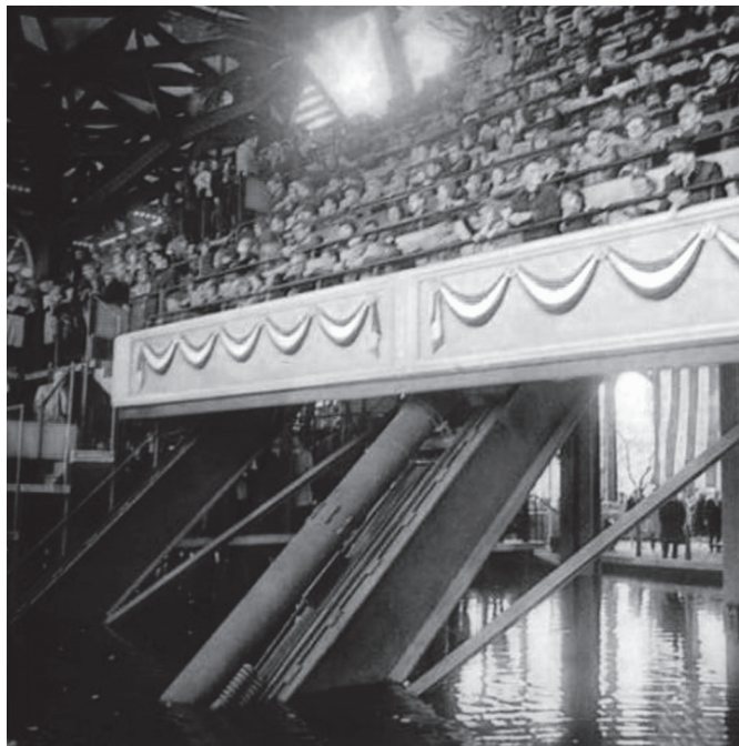
Gradins mobiles du Pavillon IBM

Tout comme dans le Pavillon IBM, la clôture participative d'un espace auditif et en mosaïque – c'est-à-dire la connexion d'informations diverses et fragmentaires – produit en réalité une forme de regroupement plus dynamique, une identification et un assujettissement à l'image électronique. McLuhan a remarqué que « [la télévision] peut virtuellement transformer le Président en monarque héréditaire. Une présidence simplement électorale n'a pas la profondeur d'engagement et de don total qu'exige la télévision » 29 .