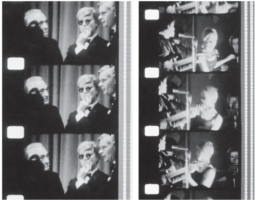
Andy Warhol, Up-Tight (Jonas Mekas, États-Unis, 1966)