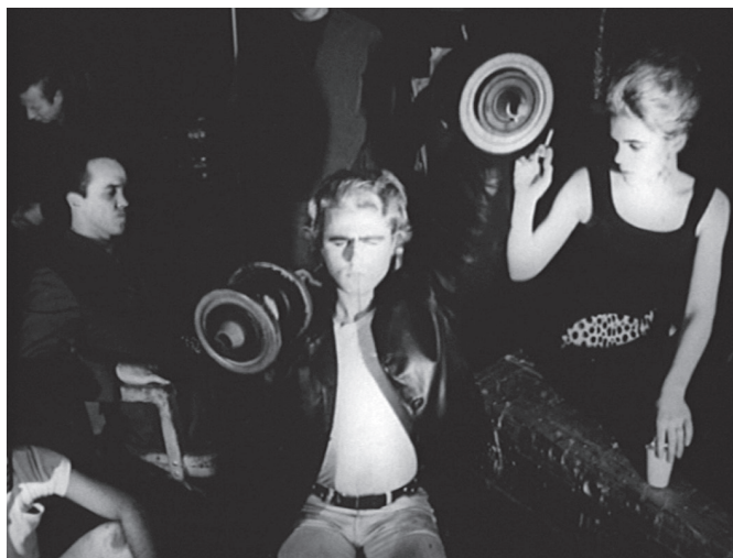
Gerard Malanga et Edie Sedgwick dans Vinyl (Andy Warhol, États-Unis, 1965)