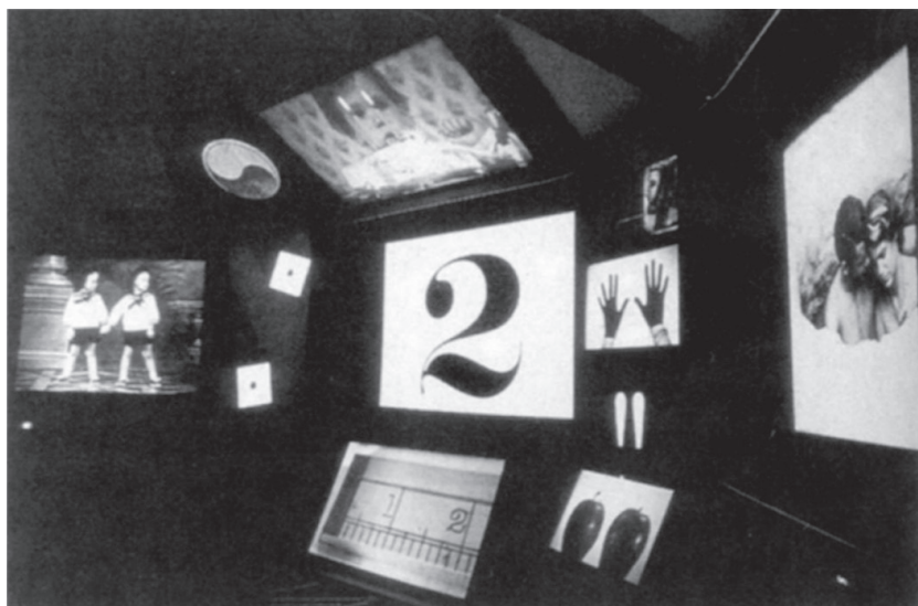
Écrans de projection à l'intérieur du Pavillon IBM (installation Think , Charles et Ray Eames, 1964)

28 Marshall McLuhan, Pour comprendre les médias , op. cit., pp. 381-382.