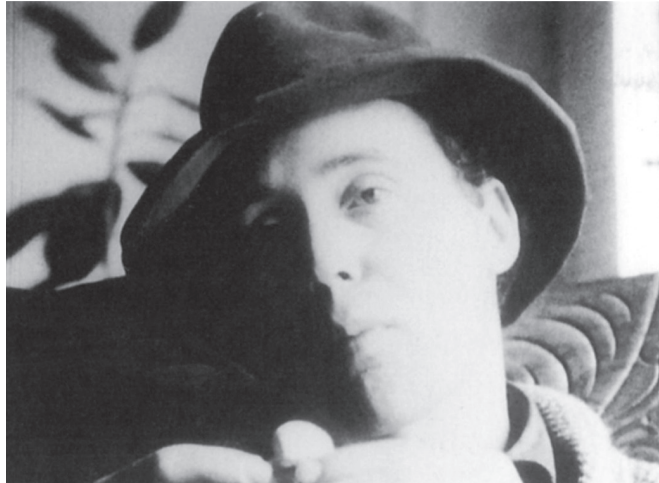
Eat (Andy Warhol, États-Unis, 1963)

Les premiers films de Warhol, comme Sleep (États-Unis, 1963), Kiss (É.-U., 1963), ou Empire (É.-U., 1964), ont été apparentés à la fois à une récupération du cinéma des premiers temps et au développement du film structurel. Aucun de ces deux aspects ne peut néanmoins caractériser l'EPI. Loin de vouloir réhabiliter d'anciens modèles cinématographiques, l'EPI – que Mekas a décrit comme « tout Ici et Maintenant, et le Futur » – a utilisé les films de Warhol comme les composantes d'un espace intermedia se caractérisant par la promiscuité impure que Krauss attribue à la télévision : à savoir, « une hétérogénéité d'activités qui ne peut pas être théorisée comme cohérente ou conçue comme possédant l'équivalent d'une essence ou d'un noyau fédérateur » 37 .