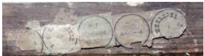
6. Matthijs Naiveu, Dame u razgovoru s kavalikom , ulje na platnu, 52 × 42 cm, Strossmayerova galerija starih majstora HAZU, inv. br. SG-707, i detalj poledine

Matthijs Naiveu, Ladies talking to a cavalier , oil on canvas, 52 × 42 cm, Strossmayerova galerija starih majstora HAZU, Strossmayer Gallery of Old Masters, inv. no. SG-707, and a detail of the back