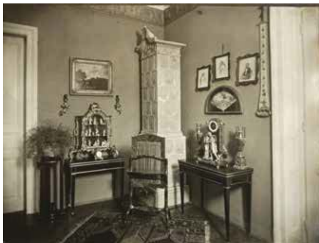
1. Interijer stana Ervina i Branke Weiss, Boškovićeve 2/1, Zagreb Interior of Ervin and Branka Weiss' apartment in Boškovićeve street 2/1, Zagreb

kulture te naredbom Ministarstva prosvjete, a na temelju zapisnika Komisije za sakupljanje i čuvanje kulturnih spomenika i starina (tzv. KOMZA), čija je poslijeratna zadaća bila i popisivanje materijala sa spomeničkim svojstvima u privatnim zbirka. 14 Takva su rješenja u načelu trebala spriječiti nametnuto useljenje sustanara koje su provodile gradske stambene vlasti, odnosno narodni odbori uživajući pravo raspolaganja stanovima. Značajan porast broja izdanih rješenja o zaštiti zbirke u Zagrebu zabilježen je tijekom 1947. godine očito kao reakcija na daljnja stežnjavanja stambenih prostora. 15 Od kraja 1946. godine Konzervatorski je zavod započeo proglašavati i zbirke s javnim značajem, u kojima nisu bili zaštićeni samo umjetnički predmeti nego i njihov razmještaj u čitavom stanu. Neizravno je time trebala biti osigurana zaštita čitavoga stana. 16 Postupak zaštite provodio je Konzervatorski zavod imenovanjem komisije koju su činili direktor Konzervatorskoga zavoda Ljubo Karaman, direktor Muzeja za umjetnost i obrt Vladimir Tkalčić i jedan predstavnik Ministarstva prosvjete. Nakon proglašenja vlasnik je bio dužan dva puta tjedno po nekoliko sati omogućiti razgled zbirke. Ujedno je trebao održavati nepromijenjen raspored umjetničkih predmeta u prostorijama određenim za izlaganje.