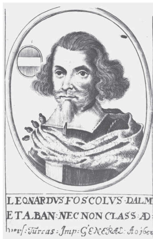
4. Nepoznati autor, Portret Leonarda Foscola , 1653. Anonymous author, Portrait of Leonardo Foscolo , 1653

nazivi (primjerice: ritratto ufficiale , ritratto di rappresentanza , portrait d'apparat , ritratto di parata ) koji ističu da je riječ o prikazu ugledne osobe, a mogu biti popraćeni i enciklopedijski opširnim natpisom koji jednostavnim ili pompoznom rječnikom, aluzijama i prispodobama opisuje prikazanu ličnost. Na Foscolovu grafičkom portretu u pozadini je prikazan Šibenik s kanalom sv. Nikole, tvrđavom sv. Mihovila s mletačkom zastavom te okolnim brdima, dok je u dnu natpis popraćen učenim stihovima: