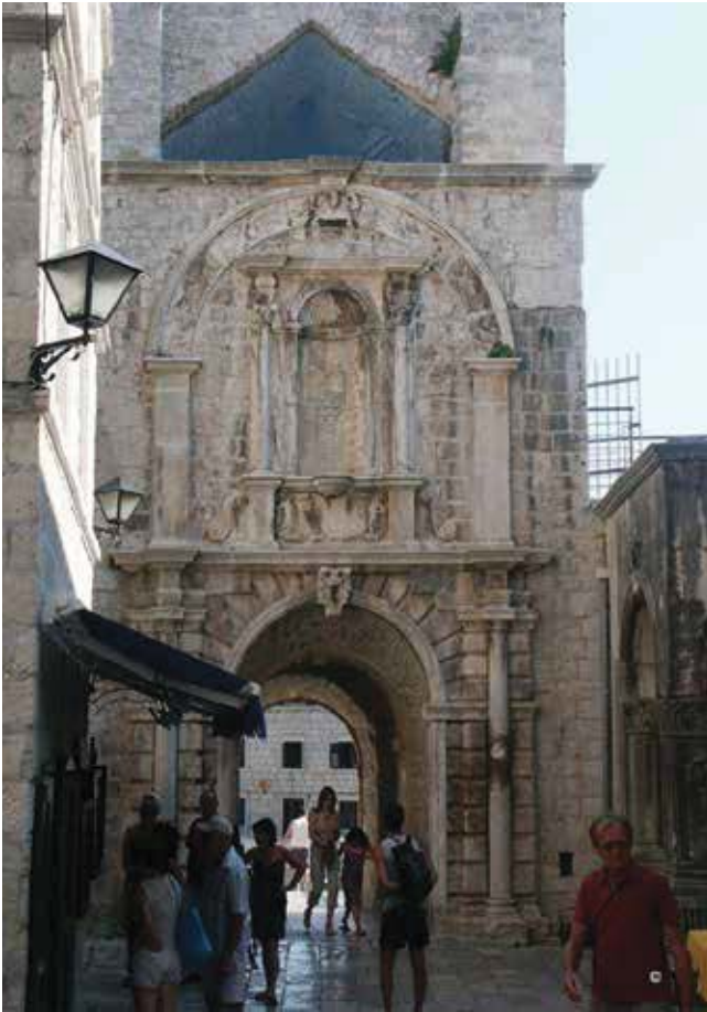
22. Slavoluk Leonardu Foscolu u Korčuli Triumphal arch of Leonardo Foscolo in Korčula

da je monumentalno zamišljen slavoluk realiziran plošnim, pretrpanim arhitektonskim i dekorativnim ukrasima s nišom za providurov kip. Njega već dugo nema u niši (navodno je uklonjen 1691. godine, ali moguće i kasnije, u drugoj polovici 19. stoljeća), ali su u nedavnom čišćenju kule Svih Sveti pronađena tri oštećena kamena kipa: dva poprsja i jedan kip do koljena. Jednom poprsju nedostaje glava, drugom su oštećeni dijelovi lica, dok je treći razbijen u više komada. Kada se na trećem kipu povežu sačuvani ulomci, dobije se kip u paradnoj vojnoj odjeći čije je lice nalik Foscolovim kipovima na grafikama i u kamenim portretima iz Splita. Vjerujem da je upravo taj kip mogao stajati u niši na slavoluku s unutarnje strane južnih gradskih vrata, uz gradsku vijećnicu.