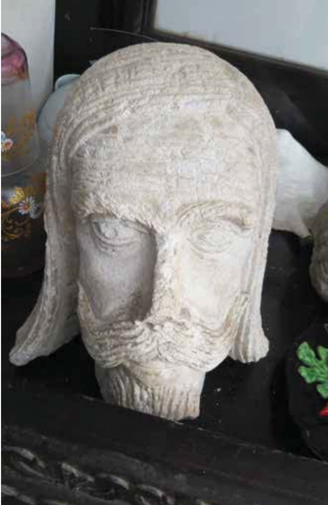
27. Glava Leonarda Foscola koja pripada skulpturi u dvorištu palače Arneri, vlasništvo obitelj Arneri u Korčuli

Head of Leonardo Foscolo from the statue in the courtyard of the Arneri Palace in Korčula, property of the Arneri family