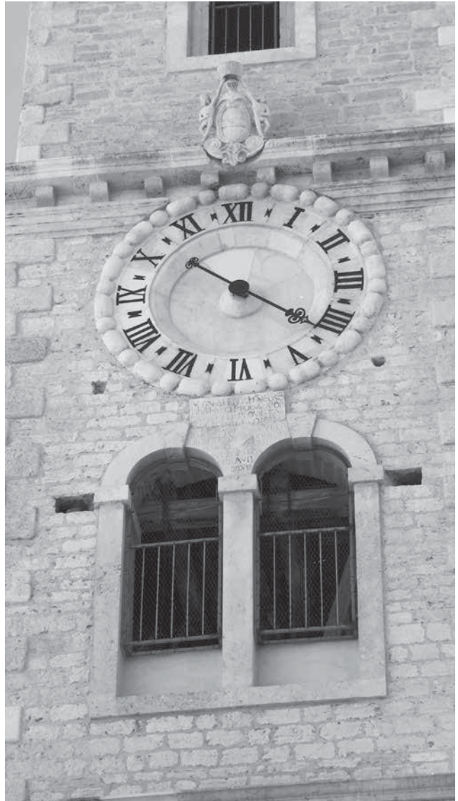
12. Sat i grb Leonarda Foscola na zvoniku crkve sv. Ivana u Šibeniku Clock and the coat of arms of Leonardo Foscolo in the belfry of the church of St John the Baptist, Šibenik

i kamenim kipovima anđela koji pridržavaju srednjovjekovnu raku, podigavši je visoko u zrak u novosagrađenom svetištu i na taj način oblikujući scenografiju crkvenog interijera u novome, baroknom ključu. Forma i sadržaj žrtvenika na neponovljiv način svjedoče nove barokne principe u kojima se povezuje staro i novo, srednjovjekovna srebrna i pozlačena škrinja sa suvremenim mramorom, kamenom i broncom, oblikujući »teatralnu« kompoziciju i scenografiju koja dominira u crkvenoj unutrašnjosti. Istovremeno se zadovoljavaju temeljni postulati Tridentskoga koncila u kojima se nalaže povratak izvorima ( ad fontes ) i to ne samo univerzalnim svecima nego i lokalnim kultovima koje će u novom rasporedu, na novim oltarima, slikama i kipovima pomoći da se obnovi i osnaži katolička vjera.