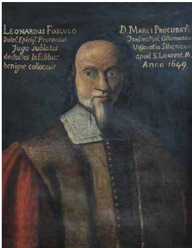
1. Nepoznati slikar, Portret Leonarda Foscola , Šibenik, Samostan sv. Lovre

Anonymous painter, portrait of Leonardo Foscolo, Šibenik, monastery of St Laurence