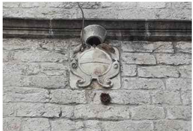
15. Grb Leonarda Foscola na pročelju crkve sv. Nikole u Šibeniku Coat of arms of Leonardo Foscolo on the front façade of St Nicholas' church in Šibenik

Zbog ratnih zasluga i ukupne politike neosporno je da ni jedan drugi vladar i vojskovođa nije stekao toliku popularnost