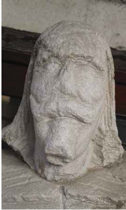
17. Kip Leonarda Foscola, Split, Muzej grada, detalj glave Statue of Leonardo Foscolo, The Split City Museum , detail of the head