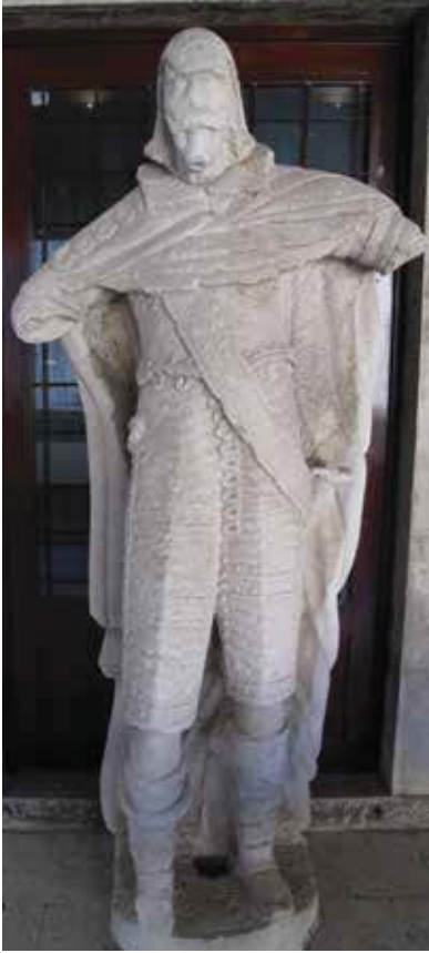
16. Kip Leonarda Foscola, Split, Muzej grada Statue of Leonardo Foscolo, The Split City Museum