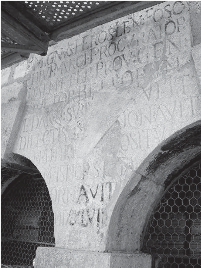
13. Natpis u lođi zvonika crkve sv. Ivana u Šibeniku Inscription in the loggia of the belfry of the church of St John the Baptist, Šibenik