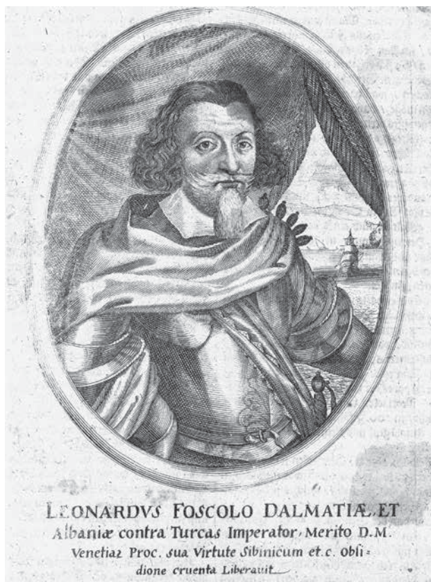
3. Nepoznati autor, Portret Leonarda Foscola Anonymous author, Portrait of Leonardo Foscolo