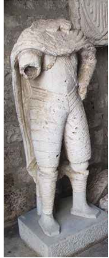
18. Kip Leonarda Foscola, Split, Muzej grada Statue of Leonardo Foscolo, The Split City Museum

bijelog kamena kip providura Leonarda Foscola. Kip je trebao biti postavljen na trgu ispred Gradske lože na kamenom postolju s natpisom koji će veličati njegove zasluge u borbi protiv Turaka i uspješnu obranu Šibenika 1647. godine, kako su sami zahvalni građani tražili. 38 Isti je majstor prema ugovoru sklopljenom 27. listopada 1653. godine trebao izraditi od korčulanskoga kamena, koji će sam odabrati, spomenik providuru Lorenzu Dolfinu (1652.–1654.), a trebao je stajati na glavnome gradskom trgu u Šibeniku. 39 Danas nije sačuvan nikakav materijalni trag navedenih kipova.