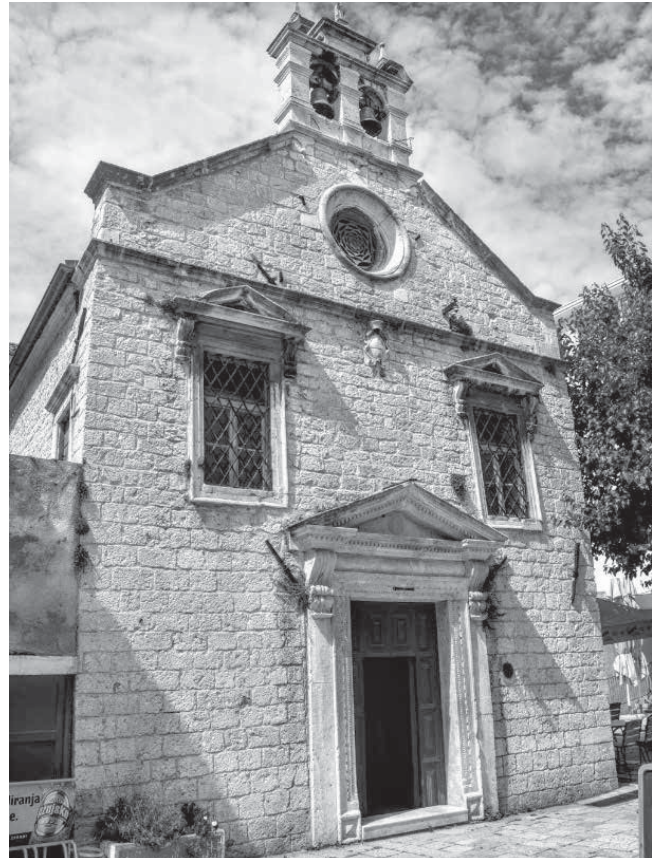
14. Crkva sv. Nikole u Šibeniku St Nicholas' church in Šibenik

zabilježenoj predaji Foscolo je, pri zauzeću Drniša 1648. godine, razrušio brojne građevine dok je s tamošnje sahatkule skinuo sat i ugradio ga na navedeni šibenski zvonik. O tome bi trebao svjedočiti Foscolov grb postavljen uz lođu pri vrhu zvonika te natpis koji se nalazi uklesan u njezinoj unutrašnjosti. Iako nepovratno oštećen, natpis bi zaista mogao upućivati na prijenos satnog mehanizma iz Drniša u Šibenik i njegovo postavljanje na visoki zvonik: 35