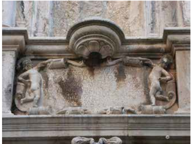
23. Natpis na Foscolovu slavoluku u Korčuli Inscription on Foscolo's triumphal arch in Korčula

I u palači Arneri u Korčuli sačuvan je dopojasni kameni kip generala Foscola izložen u niši polukružnog završetka na sjevernom zidu dvorišta. Providur je u bojnom paradnom oklopu na kojemu je isklesan u plitkom reljefu lav sv. Marka