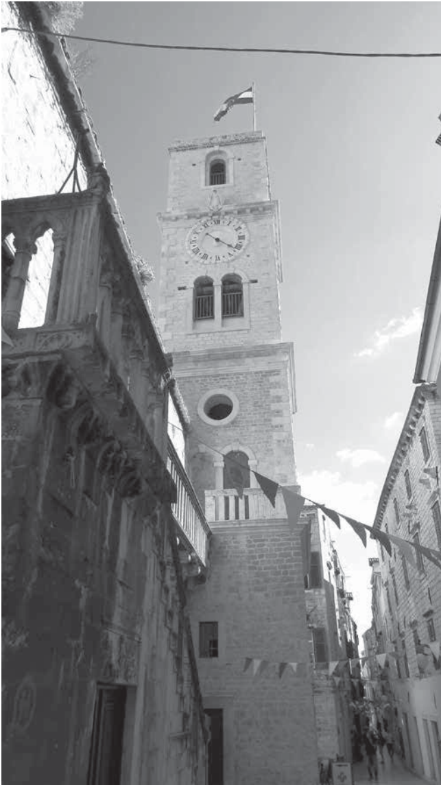
11. Zvonik crkve sv. Ivana Krstitelja, Šibenik Belfry of the church of St John the Baptist, Šibenik