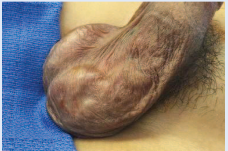
Slika 1. Izgled lijevostrane varikokele prilikom kliničkog pregleda

Rutinska slikovna dijagnostika ne preporučuje se za otkrivanje supkliničkih varikokela u pacijenata bez palpabilnih abnormalnosti 3,4,16 . Pri kliničkom pregledu nužno je utvrditi obujam i konzistenciju testisa, na temelju kojih ćemo zaključiti utječe li varikokela negativno na rast ipsilateralnog testisa. Normalna veličina testisa iznosi 1 – 2 cm 3 u dječaka prije puberteta. Veličinu testisa možemo mjeriti na nekoliko načina: komparativnim ovoidima (Praderov orhidometar), prstenastim orhidometrom ( Takahara, Rochester ) i ultrazvukom (najpreciznije). Stanje u kojem je veličina testisa smanjena za više od dvije standardne devijacije u odnosu na normalnu krivulju rasta nazivamo hipotrofijom testisa. S obzirom na postojanje individualnih razlika u rastu i razvoju, neki autori smatraju da je bolje promatrati veličinu testisa u korelaciji s Tannerovim stadijem nego kronološkom dobi pacijenta. U svakodnevnoj kliničkoj praksi lijevi testis uspoređuje se s desnim pomoću formule: (obujam desnog testisa – obujam lijevog testisa) / obujam desnog testisa x 100. U adolescenata se testis koji je više od 10 – 20 % manji u odnosu na kontralateralni testis smatra