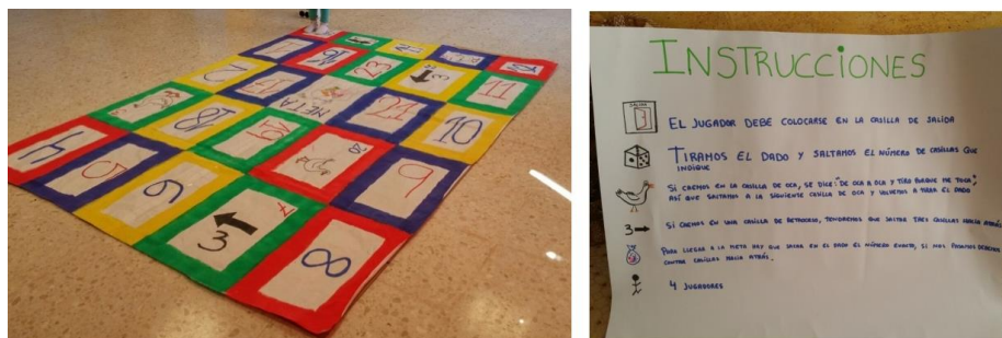
Figura 1. Tablero del juego (izquierda) y tabla de instrucciones (derecha)

retroceder tres casillas, la casilla de la oca en la que deben decir “de oca en oca y tiro porque me toca” y la casilla de salida y de meta. También se elaboraron las instrucciones y el dado (Figura 1, derecha). Este instrumento se utilizó para analizar los niveles de la fase de elaboración de Fuson y Hall (cuerda, irrompible, rompible y numerable).