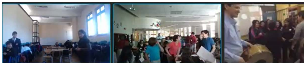
Figura 2: Clase Pública Cross Border: a la izquierda el INBA, al centro la escuela Draper Intermediate de Texas, y a la derecha la escuela Santa Rita. Todos saltan sincronizadamente.

Por otra parte, además de la participación de varios cursos de la escuela Santa Rita de Casia de La Pintana, han participado cursos del Internado Nacional Barros Arana (INBA), un curso de la escuela Fray Luis Beltrán de Valparaíso y apoyada por investigadores de la Universidad Católica de Valparaíso, y un curso de la escuela Draper Intermediate de Texas, EEUU.