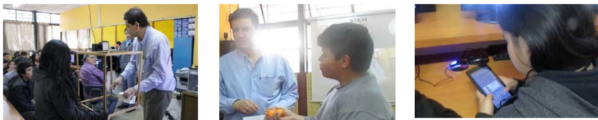
Figura 1: Clase Pública Cross Border donde se integraron conceptos centrales de matemática (estimación de volumen) y de energía (kCal generada por estudiantes). A la izquierda se observa una maqueta de la sala para ayudar a estimar su volumen y cubos blancos en la mano izquierda del profesor que modelan un metro cúbico.

Como parte de un proyecto APEC se ha diseñado, piloteado y sometiendo al proceso de Estudio de Clase una primera Clase Pública STEM en el contenido de Energía. La clase integra conceptos y prácticas centrales no sólo de física y matemática, sino además de biología, economía, ciencias sociales, tecnología e ingeniería.