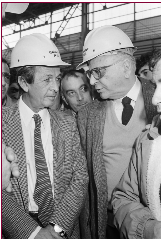
Valenzi e Berlinguer all'Italsider di Bagnoli, 1983.

80 miliardi. Non è d'accordo la Dc che sostiene essersi persi, in 14 mesi, 2.887 miliardi per opere pubbliche riguardanti attrezzature sportive, edilizia, cantieri di lavoro, metrò e altri trasporti, Centro direzionale e Palazzo di Giustizia. Il dibattito si fa acceso. Si profitta della legge Stammati-Pandolfi che consente di congelare l'indebitamento del Comune per scaricarlo sullo Stato e ripianare il consistente deficit pregresso. L'operazione, che può risollevare le disastrose finanze comunali, si completa con la concessione di un mutuo da 150 miliardi: un segno dell'attenzione che il Presidente del Consiglio, Giulio Andreotti, porta alle vicende della città (ma anche un mezzo col quale l'esponente democristiano cerca di conquistare le solidali simpatie di Enrico Berlinguer che, a sua volta, ha interesse a rafforzare, a Napoli, la Giunta di sinistra).