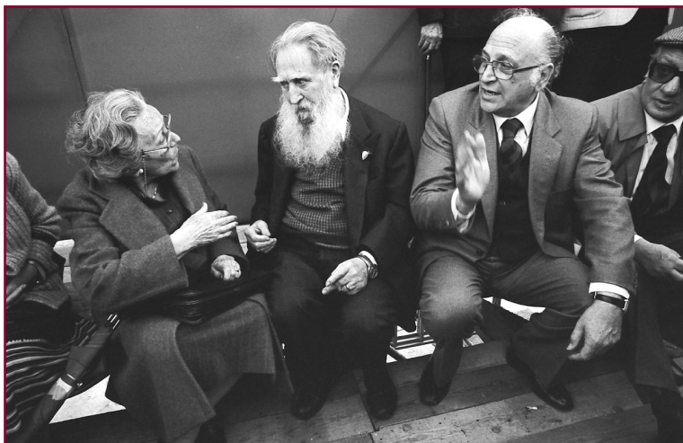
Maurizio Valenzi con il pittore Emilio Notte, 1981.

Maurizio Valenzi capiva e rispettava il ruolo della comunicazione con l'opinione pubblica, allora gestita quasi esclusivamente dalla carta stampata e dalla radiofonìa. A Napoli si pubblicava Il Mattino , legato a doppio filo con la Dc, il Roma di proprietà dell'armatore Achille Lauro (in Parlamento alleato della Dc) che sotto due diverse bandiere monarchiche era stato Sindaco della città, con i rispettivi quotidiani della sera Corriere di Napoli e Napoli Notte ; sempre a destra era schierato Il Tempo con la sua redazione di cronaca. La sinistra poteva contare sulle esigue pagine della cronaca napoletana de L'Unità , organo ufficiale del Pci, e su quelle altrettanto esigue del più diffuso Paese Sera (proprietà del Pci, che appariva nelle edicole due