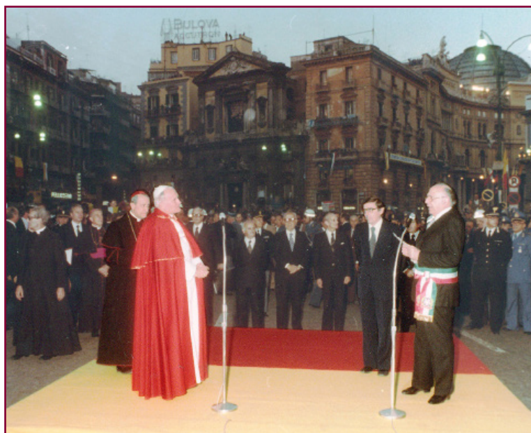
Papa Giovanni Paolo II e Maurizio Valenzi in piazza Trieste e Trento, 1979

Iniezioni di fiducia vengono anche Giovanni Paolo II, primo Papa che visita la Napoli repubblicana. Bagno di folla per lui, in piazza Plebiscito dove, come una grande star, si lascia prendere dall'entusiasmo e canta 'O sole mio . Nel suo discorso afferma che la città «non ha mai conosciuto distacchi e lacerazioni nella sua professione cristiana».