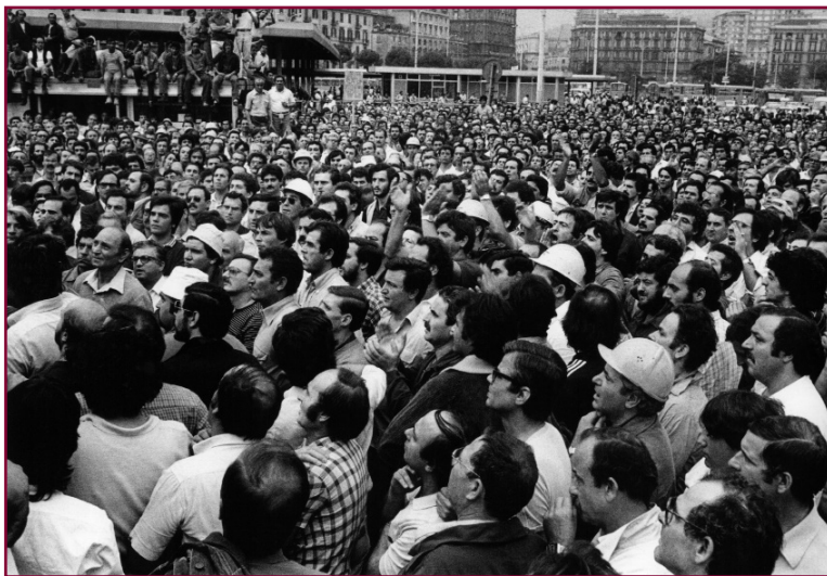
Comizio del sindaco Valenzi agli operai dell'Italsider, 1982.

Valenzi partecipa all'euforia collettiva, ma con «trepidazione e angoscia (usa un'espressione di Benedetto Croce) perché le condizioni della città non sono tra le più incoraggianti e molti degli assessori che formano la sua squadra, specie i comunisti, non hanno alcuna «conoscenza diretta della macchina amministrati-