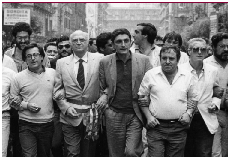
Particolare della foto alle pp. 12-13

Si susseguirono proteste sempre più dure, finché la trattativa con le Partecipazioni statali si concluse con la promessa di permanenza e ammodernamento con sistemi di antinquinamento. La Giunta comunale approvò rapidamente la necessaria Variante urbanistica e la passò alla Regione. Dove l'intera pratica si bloccò, inducendo di nuovo gli operai a una serie di manifestazioni di protesta sempre più esasperate. La battaglia durò un paio di mesi, poi arrivò in Comune la notizia che il ritardo era dovuto a una "incomprensibile sparizione". Scusa poco credibile, ma in effetti l'intero voluminoso incartamento non si trovava più, perduto o nascosto chissà dove fra corridoi e uffici del governo regionale allora in via Santa Lucia.