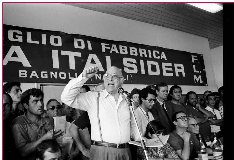
Italsider di Bagnoli, 1982.

naro va a chiedergli di ripristinare il contributo che il Comune non versava più da tempo. «Ho appreso così - commenta, non solo scherzosamente, Valenzi - che Palazzo San Giacomo era in debito anche verso il Santo Patrono».