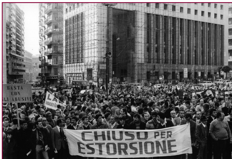
Manifestazione dei commercianti contro il racket della camorra, 1980.

da intrecci perversi fra camorra, ambienti della politica e parti inquinate della struttura statale. Inquietanti interrogativi sorgono con l'uccisione, nel quartiere di Primavalle a Roma, di Vincenzo Casillo. Il luogotenente di Cutolo che conosce i segreti della trattativa per liberare Ciro Cirillo, salta in aria dentro un'auto imbottita di tritolo. In fin di vita Mario Cuomo, super ricercato, che è con lui. L'attentato rivendicato dai "giustizieri della Campania", i feroci anti cutoliani.