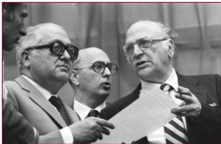
Gerardo Chiaromonte, Giorgio Napolitano e Maurizio Valenzi, 1981.

Giorgio Napolitano ha scritto nella prefazione a Maurizio Valenzi. Testimonianze per una vita straordinaria (Tullio Pironti editore, 2009) che egli è stato una figura unica nel panorama politico italiano, con tratti assolutamente originali: "L'assenza di provincialismo, la sensibilità e il gusto per la politica internazionale, l'eleganza francese, la vocazione artistica e un'umanità formata nel rapporto, innanzitutto, da borghese in un paese coloniale, con i "dannati della terra" gli diedero una visione non meschina e non settaria della politica".