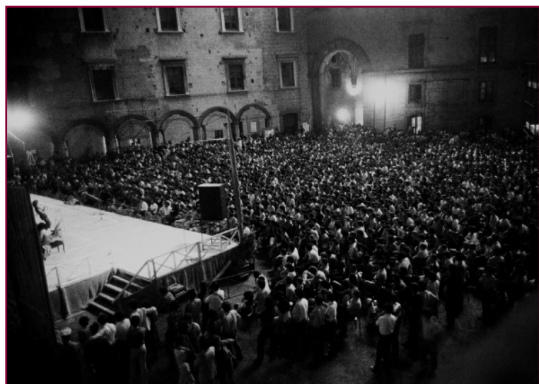
Estate a Napoli, cortile del Maschio Angioino, 1979.