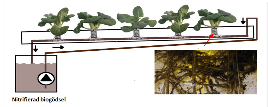
Fig 3. Odling försöken har genomförts i ett recirkulerande NFT-system och med Pak Choi som modellväxt. Den inklipta bilden visar hur rotmiljön såg ut när biogödselbaserad näringslösning användes.

När en total volym av ca 5-6 % biogödsel (v/v) har tillsatts och nitrifierats har lösningen använts för hydroponisk odling. Biofilmsbärarna filtreras bort och sparas för nästa nitrifieringsprocess. Det är viktigt att de inte torkar ut eftersom biofilmen med nitrifieringsbakterier då skadas. I den biogödselbaserade näringslösningen kommer nitrifieringsprocessen att fortsätta även om biofilmsbärarna filtrerats bort och pH kommer att behöva höjas innan odling. Detta kan göras antingen med kaliumhydrox-