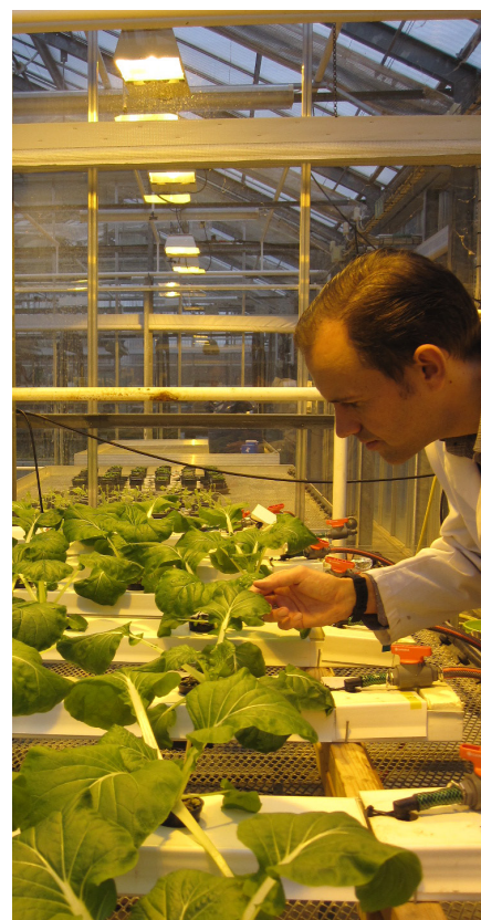
Fig. 1 Försöken har genomförts i hydroponiskt odlingssystem baserad på nutrient film technique (NFT-system).

I ett FORMAS-finansierat projekt arbetar forskare på SLU och Lunds Universitet med möjligheter, risker och intresse för produktion av grönsaker och svamp i stadsnära miljöer, i system baserade på växtnäringstillförsel med biogödsel. Detta är ett komplext område som innebär en samhällsförändring mot ett nytt, och kortare, näringskretslopp och forskning måste initieras både kring biolo-