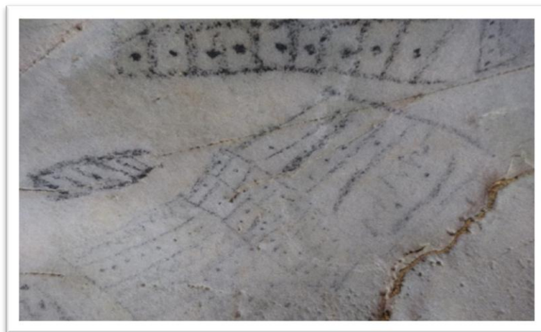
Foto 14. Lukisan bermotif sistem pengiraan