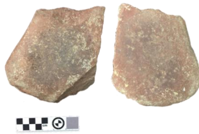
Foto 2. Batu Pelandas pandangan hadapan (kiri) dan pandangan belakang (kanan)