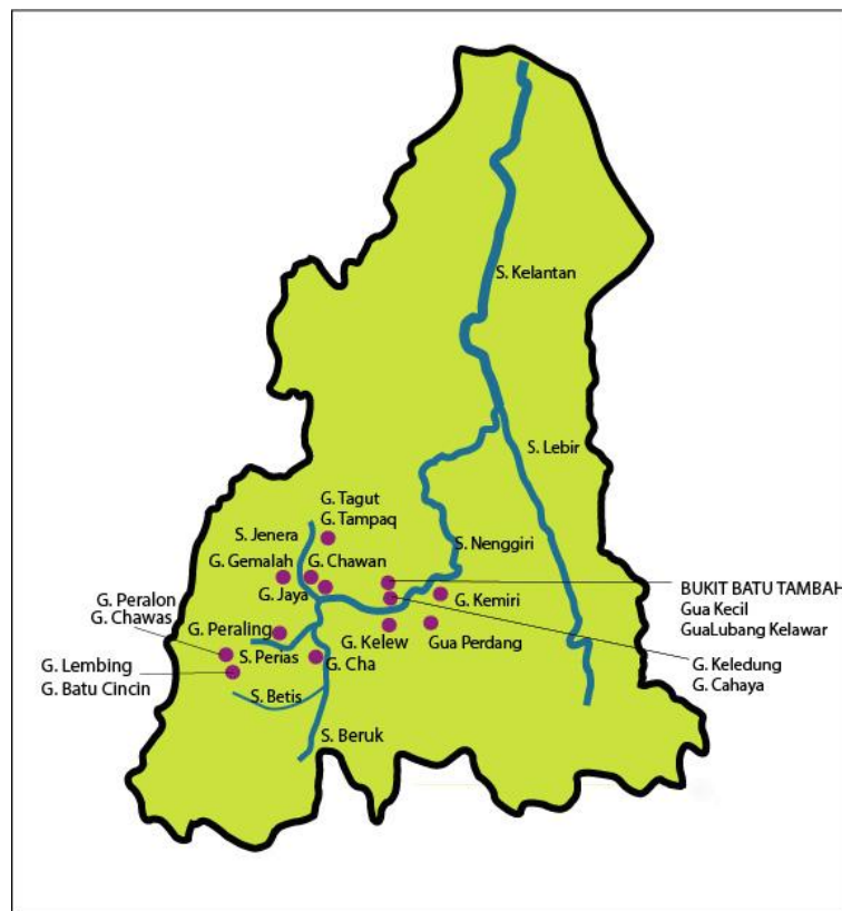
Rajah 1. Peta tapak prasejarah di Kelantan

Di Malaysia, bukti kebudayaan Paleolitik ditemui buat pertamakalinya oleh H.D Collings pada tahun 1938 di Kota Tampan Perak (Adnan et al. 2018:21) dan semenjak itu lebih banyak tapak yang ditemui. Manakala di negeri Kelantan penyelidikan dan ekskavasi arkeologi telah bermula sejak tahun 1935 oleh H.D Noone yang mana beliau telah melakukan ekskavasi percubaan di Gua Cha (Zuliskandar 2019:4). Selepas itu lebih banyak lagi tapak arkeologi prasejarah yang telah di dilakukan penyelidikan dan ekskavasi arkeologi bukan sahaja oleh sarjana barat malah turut dilakukan oleh sarjana tempatan. Antaranya ialah, Gua Madu, Gua Musang, Gua Cha, Gua Chawas, Gua Peraling dan yang terbaru di Gua Jaya dan Gua Chawan.