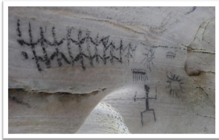
Foto 12. lukisan berimej antropomorfik