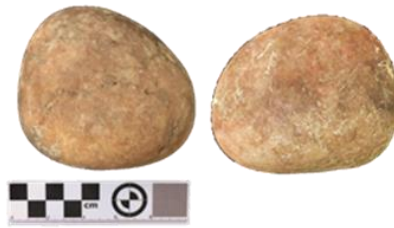
Foto 8. Grind Pounder

Pahat (Foto 7) merupakan salah satu daripada alat batu yang dicipta pada zaman Prasejarah iaitu dipercayai dicipta pada Zaman Neolitik. Pahat memiliki ciri-ciri seperti berbentuk segi empat atau berbentuk silinder dimana matanya berbentuk tirus dan tajam dan digunakan untuk kerja-kerja pertukangan contohnya untuk membuang serat kayu. Grind pounder (Foto 8) biasanya mempunyai kebolehan untuk menghancurkan dan juga mengisar batuan bematite . Terdapat kesan kemerahan pada permukaan grind pounder yang menunjukkan alat ini telah digunakan untuk menghancurkan bematite .