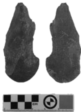
Foto 6. Pengikis

Batu pelicin (Foto 5) dicirikan dengan memiliki kesan guna ataupun kesan calar pada permukaan batu tersebut. Batu pelicin digunakan untuk melicinkan ataupun mengasah alat batu. Pengikis atau scraper (Foto 6) turut ditemui sewaktu ekskavasi arkeologi yang dilakukan di Gua Lubang Kelawar Batu Tambah. Terdapat beberapa jenis pengikis iaitu side scraper , end scraper , convex scraper dan round scraper . Batuan yang digunakan untuk mencipta pengikis di Gua Lubang Kelawar ini ialah batuan jenis sabak. Pada kebiasaanya pengikis diperbuat daripada flake serta dicirikan dengan memiliki bahagian matanya yang tajam dan mempunyai kebolehan untuk mengikis. Pengikis digunakan untuk meraut atau turut digunakan untuk memotong ranting kayu yang kecil.