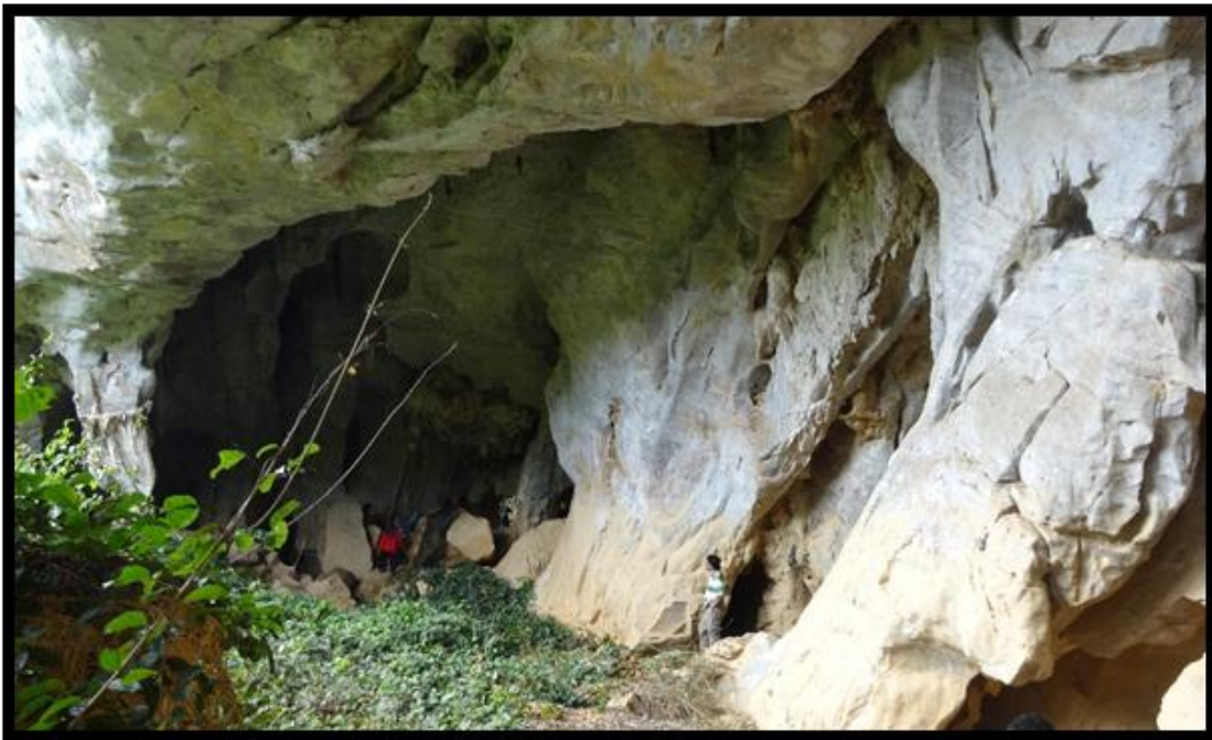
Foto 1. Pandangan hadapan Gua Lubang Kelawar Batu Tambah