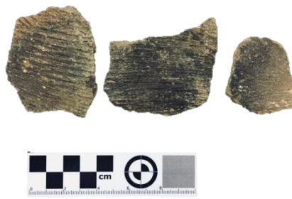
Foto 10. Tembikar bahagian badan bermotif cord mark

Sebanyak 171 pecahan tembikar tanah dijumpai di Gua Lubang Kelawar Batu Tambah sewaktu ekskavasi iaitu terdiri daripada 25 bahagian bibir, 122 bahagian badan dan 24 bahagian karinasi. Jumpaan bahagian badan yang bermotif adalah sebanyak 91 manakala sebanyak 31 bahagian badan yang tidak bermotif. Hanya terdapat satu motif sahaja iaitu motif cord mark yang dijumpai di gua ini. Terdapat juga penemuan gelang batu (Foto 11) yang tidak lengkap bentuknya. Dipercayai bahawa gelang batu ini digunakan untuk tujuan perhiasan pada masa tersebut.