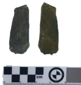
Foto 7. Pahat

Batu pelicin (Foto 5) dicirikan dengan memiliki kesan guna ataupun kesan calar pada permukaan batu tersebut. Batu pelicin digunakan untuk melicinkan ataupun mengasah alat batu. Pengikis atau scraper (Foto 6) turut ditemui sewaktu ekskavasi arkeologi yang dilakukan di Gua Lubang Kelawar Batu Tambah. Terdapat beberapa jenis pengikis iaitu side scraper , end scraper , convex scraper dan round scraper . Batuan yang digunakan untuk mencipta pengikis di Gua Lubang Kelawar ini ialah batuan jenis sabak. Pada kebiasaanya pengikis diperbuat daripada flake serta dicirikan dengan memiliki bahagian matanya yang tajam dan mempunyai kebolehan untuk mengikis. Pengikis digunakan untuk meraut atau turut digunakan untuk memotong ranting kayu yang kecil.