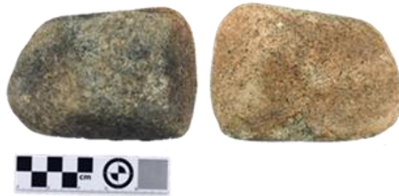
Foto 5. Batu Pelicin

di Gua Lubang Kelawar Batu Tambah ini terdapat penemuan artifak yang dipercayai mempunyai ciri-ciri kebudayaan Zaman Neolitik. Antaranya ialah alat batu seperti batu pelicin, pengikis, pahat dan grind poulder . Selain itu terdapat juga penemuan tembikar tanah dan gelang batu.