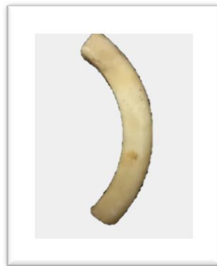
Foto 11. Gelang batu

Sebanyak 171 pecahan tembikar tanah dijumpai di Gua Lubang Kelawar Batu Tambah sewaktu ekskavasi iaitu terdiri daripada 25 bahagian bibir, 122 bahagian badan dan 24 bahagian karinasi. Jumpaan bahagian badan yang bermotif adalah sebanyak 91 manakala sebanyak 31 bahagian badan yang tidak bermotif. Hanya terdapat satu motif sahaja iaitu motif cord mark yang dijumpai di gua ini. Terdapat juga penemuan gelang batu (Foto 11) yang tidak lengkap bentuknya. Dipercayai bahawa gelang batu ini digunakan untuk tujuan perhiasan pada masa tersebut.