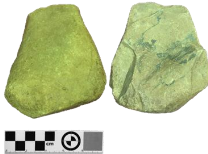
Foto 15. Alat penetak

Hasil daripada jumpaan artifak di Gua Lubang Kelawar Batu Tambah telah membuktikan bahawa sememangnya gua ini pernah digunakan oleh manusia pada suatu masa dahulu. Jumpaan artifak seperti alat batu contohnya alat penetak, kapak, batu pemukul dan batu pelandas sememangnya memiliki ciri alat batu Zaman Hoabinhian. Kapak dan alat penetak (Foto 15) ini dipercayai digunakan untuk menetak atau membuang hujung cangkerang siput. Ini dibuktikan dengan jumpaan cangkerang siput yang telah dipotong bahagian hujungnya. Kebiasaanya alat batu dicipta untuk kegunaan yang bersesuaian dengan persekitaran hidup mereka.