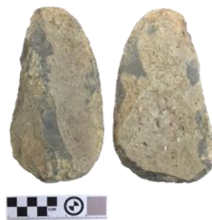
Foto 3. Kapak

Sewaktu ekskavasi dilakukan, turut ditemui ialah kapak batu (Foto 3). Pada kebiasaannya kapak digunakan sebagai alat untuk memotong seperti kayu, buluh dan mungkin juga digunakan untuk memotong hujung cangkerang siput serta memotong haiwan buruan mereka. Terdapat sebanyak 11 kapak yang ditemui di Gua Lubang Kelawar Batu Tambah yang terdiri daripada batuan jenis syis, quartz , hornfels , sabak dan batu kapur. Batu pemukul (Foto 4) merupakan salah satu daripada artifak yang ditemui dan dikatakan memiliki ciri alat Zaman Hoabinhian. Pada kebiasaannya batu pemukul bersaiz genggam dan digunakan untuk membentuk atau mendapatkan repehan pada batu teras. Batu pemukul ini kebanyakannya menggunakan batuan jenis sabak, batu pasir ( sandstone ), quartz , quartz vein , quartz mica schist dan quartz-biotite schist .