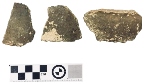
Foto 9. Tembikar bahagian badan tidak bermotif