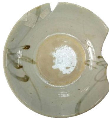
Foto 16. Seramik Dinasti Ching

Alat batu seperti pahat, pengikis, batu pelicin dan grind pounder memiliki ciri-ciri alat batu Zaman Neolitik. Hal ini kerana dipercayai manusia yang hidup pada zaman ini memiliki intelektual yang lebih tinggi. Oleh itu mereka telah mencipta peralatan yang lebih canggih dan saiz peralatan yang lebih kecil dan bersesuaian dengan persekitaran pada masa tersebut. Penemuan tembikar tanah serta gelang batu telah mengukuhkan lagi bukti bahawa masyarakat Neolitik sememangnya telah menggunakan gua tersebut sebagai tempat persinggahan dan perlindungan. Selain daripada itu, terdapat penemuan seramik yang dipercayai bahawa ianya merupakan seramik dari Dinasti Ching (Foto 16).