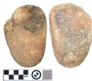
Foto 4. Batu Pemukul

Sewaktu ekskavasi dilakukan, turut ditemui ialah kapak batu (Foto 3). Pada kebiasaannya kapak digunakan sebagai alat untuk memotong seperti kayu, buluh dan mungkin juga digunakan untuk memotong hujung cangkerang siput serta memotong haiwan buruan mereka. Terdapat sebanyak 11 kapak yang ditemui di Gua Lubang Kelawar Batu Tambah yang terdiri daripada batuan jenis syis, quartz , hornfels , sabak dan batu kapur. Batu pemukul (Foto 4) merupakan salah satu daripada artifak yang ditemui dan dikatakan memiliki ciri alat Zaman Hoabinhian. Pada kebiasaannya batu pemukul bersaiz genggam dan digunakan untuk membentuk atau mendapatkan repehan pada batu teras. Batu pemukul ini kebanyakannya menggunakan batuan jenis sabak, batu pasir ( sandstone ), quartz , quartz vein , quartz mica schist dan quartz-biotite schist .