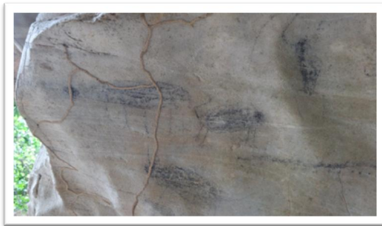
Foto 13. Lukisan berimej zoomorfik