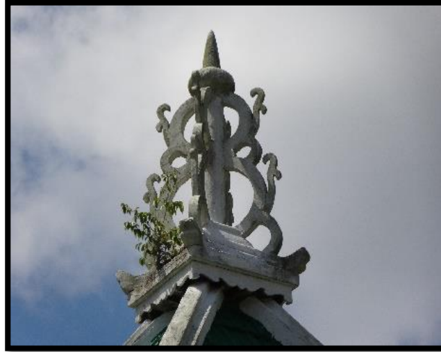
Foto 2. Rekaan Mahkota Atap Masjid Ayer Barok, Jasin

Masjid ini merupakan masjid lama Ayer Barok di Melaka yang terletak di Daerah Jasin. Masjid ini telah dibina pada tahun 1917 dan ia merupakan masjid utama yang digunakan oleh penduduk di sekitar Pekan Jasin pada masa dahulu. Masjid ini mempunyai ketinggian mahkota atap yang unik sebanyak tiga tingkat yang dihiasi seni ukir daripada batu. Masjid ini mempunyai struktur bangunan yang berbentuk empat persegi yang digabungkan daripada bahan batu dan kayu manakala bumbungnya yang berlapis tiga disusun dengan menggunakan genting 'marseille'. Namun pada tahun 1969, selepas masjid baru di bina, masjid ini tidak lagi digunakan sepenuhnya dan hanya digunakan untuk kegiatan agama oleh penduduk sekitar pekan Jasin. Pada tahun 2002, Jabatan Muzium dan Antikuiti telah menjalankan kerja-kerja pemuliharaan bagi masjid ini.