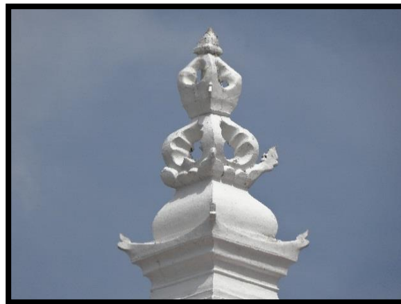
Foto 1. Rekaan Mahkota Atap bagi Masjid Al Hamideen, Melaka Tengah

Seni bina masjid warisan Melaka mempunyai gayanya yang tersendiri yang mempunyai ciri yang penting dan ketara. Seni bina masjid di Melaka lebih terserlah dengan adanya hiasan pada puncak yang boleh dilihat di atas bumbung yang berbentuk piramid. Menurut Ros Mahwati & Nik Hassan Shuhaimi (2012) dalam artikelnya yang bertajuk Motif Hiasan Tiga Buah Masjid abad ke-18 telah menamakan hiasan pada puncak bumbung sebagai mahkota. Manakala, menurut Nash (1998), hiasan bahagian paling atas pada puncak turut dikenali dengan beberapa nama seperti kepala som dan mahkota atap (Abdul Halim 2004).