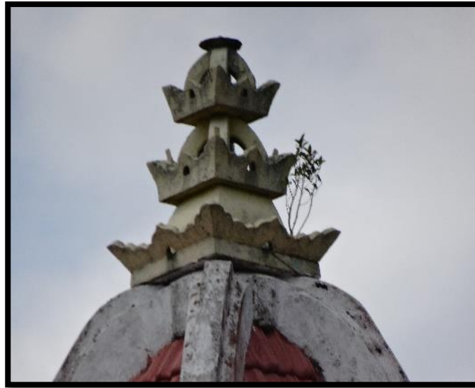
Foto 4. Rekaan Mahkota Atap Masjid Nurul Iman, Jasin

Mahkota atap masjid Nurul Iman Ayer Panas ini merupakan masjid yang terletak di Daerah Jasin yang mana ianya mempunyai ketinggian mahkota sebanyak empat tingkat. Masjid ini berada di sekitar kawasan kampung dan terletak di tepi jalan bagi memudahkan penduduk sekitar kawasan menggunakannya.