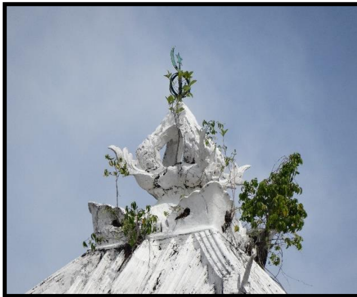
Foto 5. Rekaan Mahkota Atap Masjid Tengker, Melaka Tengah

Mahkota atap masjid Nurul Iman Ayer Panas ini merupakan masjid yang terletak di Daerah Jasin yang mana ianya mempunyai ketinggian mahkota sebanyak empat tingkat. Masjid ini berada di sekitar kawasan kampung dan terletak di tepi jalan bagi memudahkan penduduk sekitar kawasan menggunakannya.