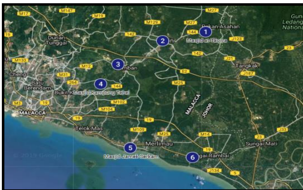
Peta 2. Lokasi Masjid Warisan di Daerah Jasin