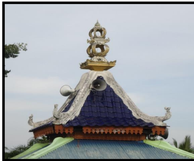
Foto 3. Rekaan Mahkota Atap Masjid Kg Tehel, Jasin

Masjid ini merupakan masjid lama Ayer Barok di Melaka yang terletak di Daerah Jasin. Masjid ini telah dibina pada tahun 1917 dan ia merupakan masjid utama yang digunakan oleh penduduk di sekitar Pekan Jasin pada masa dahulu. Masjid ini mempunyai ketinggian mahkota atap yang unik sebanyak tiga tingkat yang dihiasi seni ukir daripada batu. Masjid ini mempunyai struktur bangunan yang berbentuk empat persegi yang digabungkan daripada bahan batu dan kayu manakala bumbungnya yang berlapis tiga disusun dengan menggunakan genting 'marseille'. Namun pada tahun 1969, selepas masjid baru di bina, masjid ini tidak lagi digunakan sepenuhnya dan hanya digunakan untuk kegiatan agama oleh penduduk sekitar pekan Jasin. Pada tahun 2002, Jabatan Muzium dan Antikuiti telah menjalankan kerja-kerja pemuliharaan bagi masjid ini.