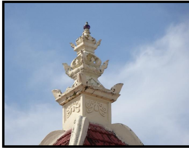
Foto 6. Rekaan Mahkota Atap Masjid Peringgit, Melaka Tengah

Masjid ini telah dibina semula pada tahun 1293 setelah masjid peringgit yang lama dimusnahkan pada tahun 1141. Masjid ini berbentuk empat persegi dan bahan binaannya terdiri daripada batu laterit dan batu bata. Manakala hiasan pada puncak bumbung diperbuat daripada batu karang yang berukir. Masjid ini hanya digunakan oleh penduduk setempat sahaja untuk solat harian dan tidak lagi digunakan untuk solat jumaat kerana telah dibina sebuah masjid negeri berhampiran Masjid Peringgit.