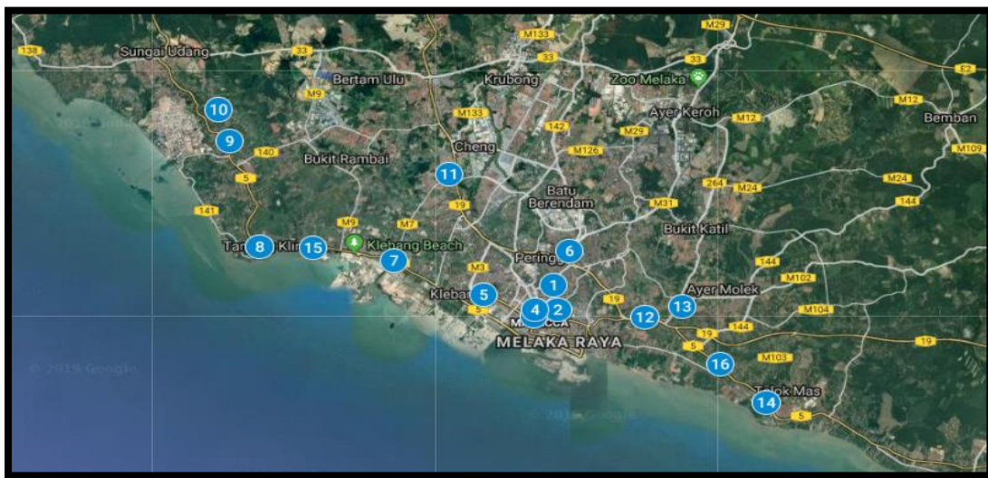
Peta 3. Peta Daerah Melaka Tengah