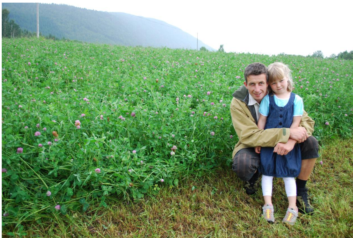
Rødkløver kan dominere i enga når forholdene ligger til rette for det.

Rødkløver har en annen strategi enn hvitkløver. Den har røtter som går dypt ned i jordprofilen. Den mest tørketolerante belgveksten er imidlertid luserne. Evans (1978) fant at luserne kan hente ut vann fra mer enn to meters dyp, og langt overgikk hvitkløver og raigras. Den har dessuten bedre evne til å økonomisere med vannressursene enn det kløver har (Frame m.fl. 1998).