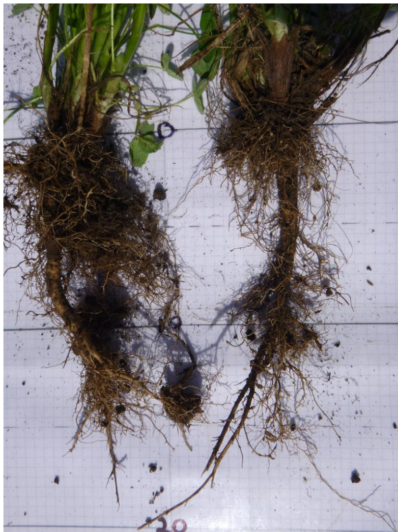
Voksne rødkløverplanter har et omfattende rotsystem rundt pålerota.

Andre arter enn kløver har et mer bestandig plantemateriale. Effekten av tilført kløvermasse alene, spesielt hvitkløver, er kortvarig. I et inkubasjonsforsøk som varte 127 dager fant Wang m.fl. (2010) at bare 55 % av karbon tilført i hvitkløvermateriale var igjen i jorda. Til sammenligning var det 79 % igjen av karbonet tilført med raigras. Dette samsvarer godt med en rask omdanning av hvitkløver, som igjen bidrar til god jordstruktur og næring til jordlivet og andre planter.