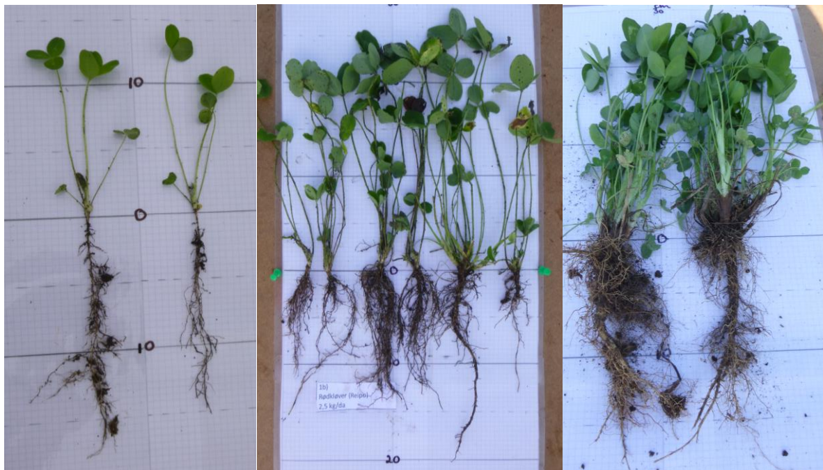
Rødkløverplanter i ulike utviklingsstadier.

Selv om den er flerårig, går rødkløver i praksis ofte ut etter to til tre år (Frame m.fl. 1998). Foruten nitrogengjødsling, høstemetode og jordpakking kan dette skyldes overvintringsskader eller ulike skadegjørere. For å beholde rødkløver i langvarig eng kan det derfor være nødvendig å jevnlig så nytt kløverfrø i eksisterende eng (direktesåing).