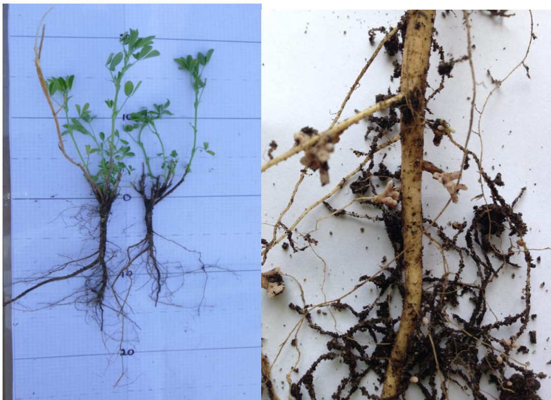
Luserne (Medicago sativa) kan være en aktuell engbelgvekst noen steder. Unge planter til venstre. Rot av voksen luserneplante, med rotknoller, til høyre.