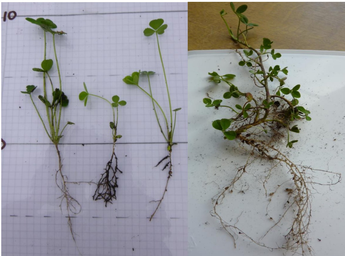
Kvitkløverplanter, unge til venstre, voksen plante til høyre.

Hvitkløver er en flerårig plante som har krypende, rotslående stengler (stolonene). Stolonene kan bli 50 cm lange og fungerer som transportvei, lager og spredningsvei for hvitkløver. Nye planter vokser fram enkelte steder på disse stolonene og det dannes nye røtter og nye planter. Hvitkløverplantene er kortvokste, 10-20 cm høye, og tåler både beite og hyppig slått godt. Den er derfor mer vanlig i langvarig eng og beite. Gjenveksten etter slått kommer gjerne raskt i gang. Frøplanter utvikler et overfladisk rotsystem med enkelte pålerøtter, men disse blir aldri så kraftige som hos rød-kløver.