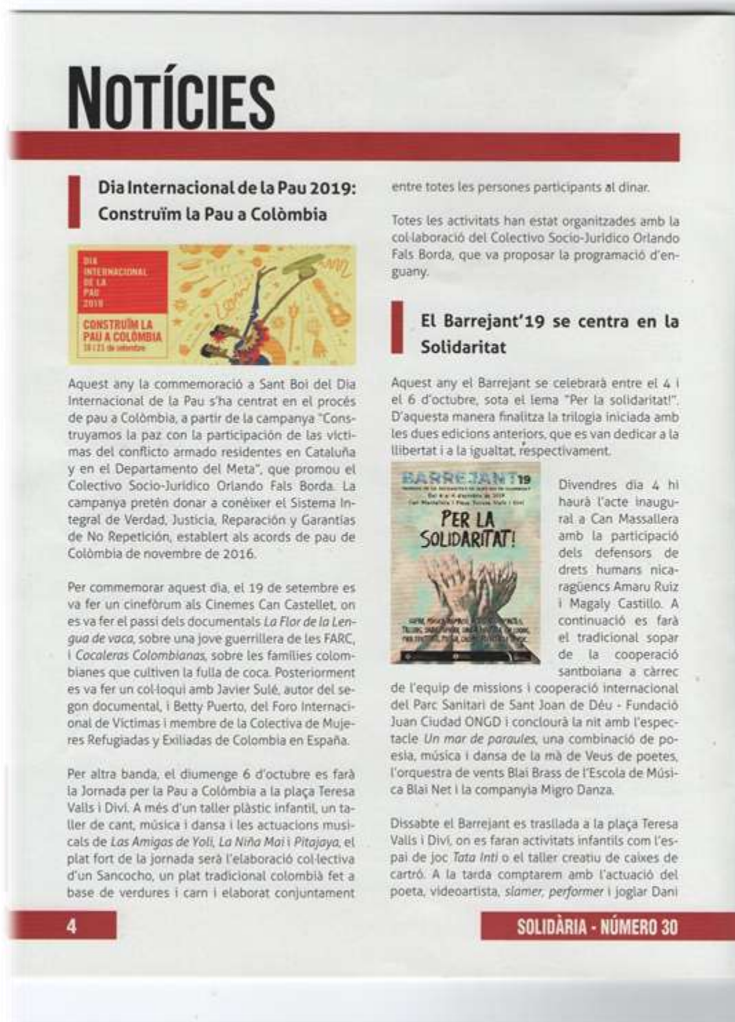
Fig.1. Pàgina 4 del Boletín de Cooperación, Solidaridad y Paz, "Solidària", donde se nos informa del Barrejant'19 . Número 30. Octubre del 2019. Escaneada por Iván Ginés.