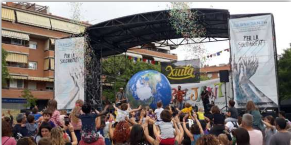
Fig. 4. Imagen del Barrejant 2019: “PER LA SOLIDARITAT”.