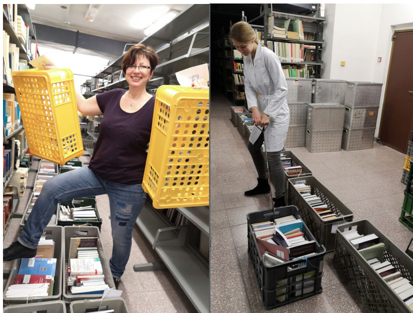
Obrázek 7 Stěhování fondu Fakulty bezpečnostního inženýrství