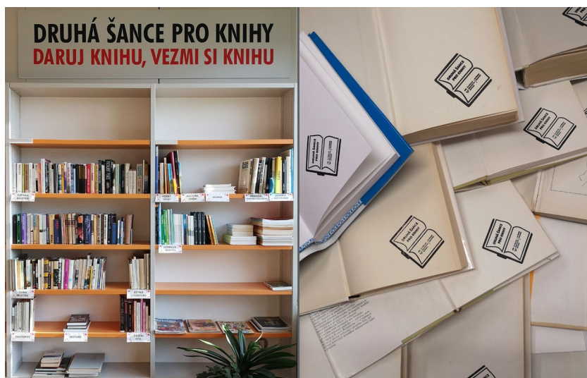
Obrázek 8 Knihovnička Druhá šance pro knihy

Kolegyně z výpůjčního oddělení založily knihovničku beletrie s názvem Druhá šance pro knihy . Princip knihovničky spočívá v dobrovolném darování knihy či knih a volném půjčení libovolného titulu/ů. Půjčení knihy není podmíněno darováním jiné knihy, ani jejím vrácením. Knihy jsou označeny razítkem s logem Druhá šance.