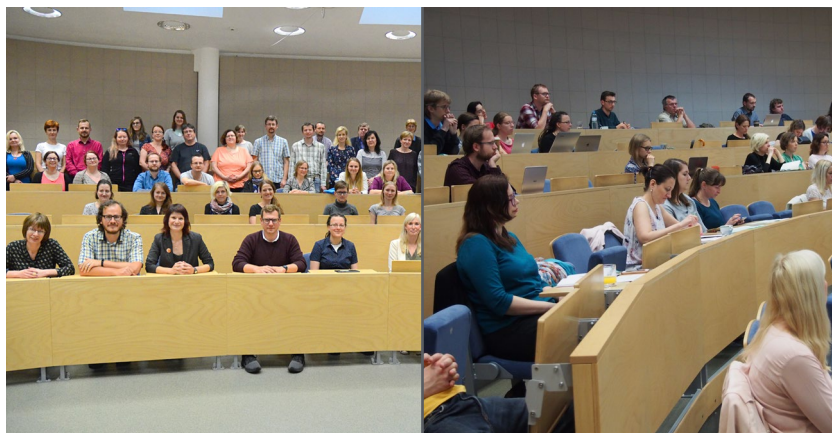
Obrázek 5 Seminář Otevřený repozitář 2019

Ředitelka ÚK byla pozvána do pracovní skupiny otevřeného přístupu při RVVI, jejímž úkolem je zajištění realizace opatření Akčního