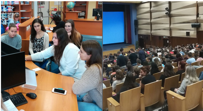
Obrázek 2 Individuální a hromadná školení pro studenty EKF

ÚK poskytuje studentům adresné informace o službách knihovny na hromadných akcích pro první ročníky i formou individuálních konzultací. Výčet všech uskutečněných školení, prezentací pro první ročníky, vyžádaných školení ve výuce, školy pro doktorandy aj., viz níže v oddílu Akce zajišťované ÚK .