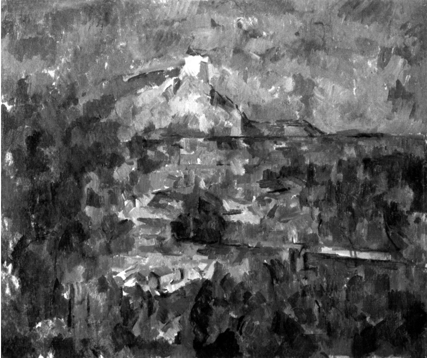
Abb. 1: Paul Cézanne, »Montagne Ste. Victoire«, 1904/06, 60 x 72 cm, Öl auf Leinwand, Kunstmuseum Basel. Aus: Martina Sauer, Cézanne, van Gogh, Monet. Genese der Abstraktion, Bühl 2000, Anhang (Abb. 1).

Zur Verdeutlichung des Unterschieds soll hier als Beispiel ein Spätwerk Paul Cézannes, eine Fassung der »Montagne Ste. Victoire« von 1906 herangezogen werden (Abb. 1). Schnell wird deutlich: Die Details des Motivs sind wegen der vereinzelt Strichführung ( taches ) kaum differenzierbar, und dennoch entsteht der Eindruck von stiller Größe. Wie ist das möglich? Es handelt sich ja gerade nicht um einen Berg am See mit einem Boot. Das heißt, am Motiv kann sich diese Wertung kaum festmachen. Verständlich und nachvollziehbar wird sie jedoch, wenn auf das Erregungspotential der gleichförmig über das Bild verteilten taches geachtet wird. Stimmungsmäßig vermittelt sich über sie unendliche Ruhe. Bezogen auf den Berg, der durch den angedeuteten Umriss deutlicher hervortritt und mit seiner Stellung über der Horizontlinie einen Wechsel von der Aufsicht in die Ebene davor zu einer Untersicht veranlasst, gewinnt die Erfahrung an Bedeutung: Über das eigenen Erleben vermag dem Motiv eine gewisse Würde und Erhabenheit zugeschrieben werden. 12 Hieran schließt die entscheidende Frage