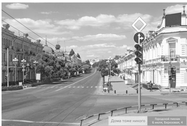
Рис. 1. Омск как «зомбитаун»

Более глубокий анализ, учитывающий символический статус запечатленного на этой фотографии места (это одна из главных точек омского исторического центра – перекресток улиц Ленина, Щербанева и Партизанской), обнаруживает здесь визуализацию стереотипа «Омск – мертвый город» и приглашение омичей в альтернативное, живое пространство ГП, что безошибочно считывают те, кому предназначался данный снимок: