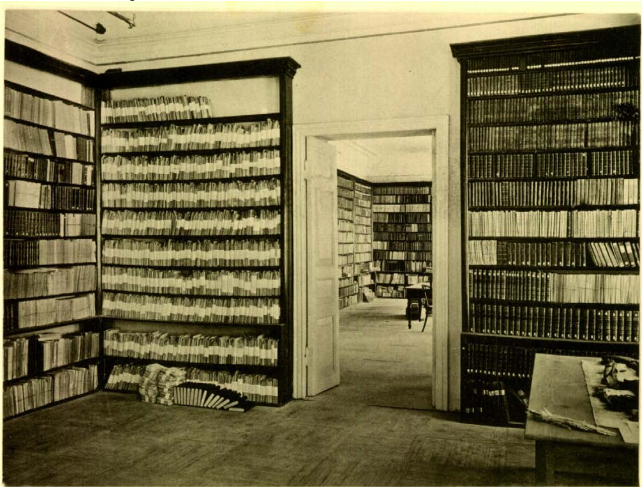
В библиотеке Императорского Томского университета в конце XIX в.

наследник проследовал на пароходную пристань для дальнейшего пути. На пароходе «Николай» он направился в Тобольск [7, с. 102].