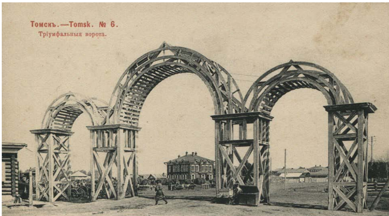
Томскъ.—Tomsk. № 6. Триумфальныя ворота.

К моменту встречи цесаревича в г. Томске была проведена огромная подготовительная работа. Прежде всего были проведены благоустроительные работы по приведению в порядок улиц, зданий и сооружений. Об этом красноречиво сообщается в «Сибирском вестнике»: «Весь город в ожидании Его Императорского Высочества Наследника Цесаревича убран флагами и зелень, но некоторые здания, как частные, так и казенные, обращают на себя особенное внимание, благодаря изяществу и вкусу, с которым они убраны» [3]. К приезду наследника напротив Свято-Троицкого собора (ныне – Новособорная площадь) был построен дом губернатора (ныне Дом ученых), располагавший 42 комнатами [4, с. 106]. Для встречи цесаревича в районе Белого озера была построена Триумфальная арка и деревянный павильон. Купцом Кухтериным в селе Семилужки был построен гостевой домик, предназначенный для приема и ночлега Великого князя Николая Александровича.