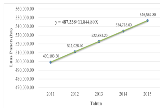
Gambar 2. Trend Luas Panen (ha) Komoditas Unggulan Padi Propinsi Sumatera Barat (2011-2015)

terhadap luas panen komoditas unggulan padi sawah , didapatkan persamaan regresi sebagai berikut : Y = 487.338 + 11.844,50 X . Berdasarkan Persamaan tersebut diketahui bahwa komoditas unggulan padi sawah mengalami peningkatan luas panen sebesar 11.844,50 ha setiap tahunnya atau mengalami surplus dan diperkirakan pada tahun 2016 luas panen komoditas unggulan padi sawah menjadi sebesar 558.407,30 ha (Gambar 2).