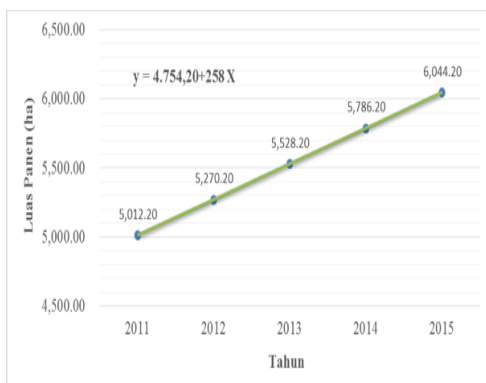
Gambar 3. Trend Luas Panen (ha) Komoditas Unggulan Ubi Jalar Propinsi Sumatera Barat (2011-2015)

peningkatan luas panen sebesar 258 ha setiap tahunnya atau mengalami surplus dan diperkirakan pada tahun 2016 luas panen komoditas unggulan ubi jalar menjadi sebesar 6.302,20 ha (Gambar 3).