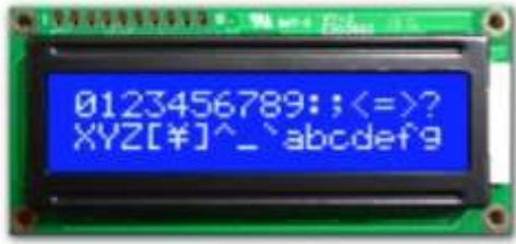
gambar 6 LCD 16x2

Huruf atau angka yang akan ditampilkan dikirim ke LCD dalam bentuk kode ASCII, kode ASCII ini diterima dan diolah oleh mikrokontroler di dalam LCD menjadi „titik-titik“ LCD yang terbaca sebagai huruf atau angka. Dengan demikian tugas mikrokontroler pemakai tampilan LCD hanyalah mengirimkan kode-kode ASCII untuk ditampilkan [4].