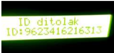
gambar 14 Tampilan ID ditolak

Melakukan tag dengan ID yang belum terdaftar tidak akan memberikan hak akses yang ditandai buzzer berbunyi 2 kali dan LCD menampilkan bahwa ID ditolak.