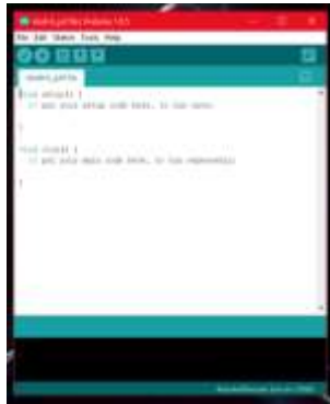
gambar 7 Sketch baru Arduino IDE