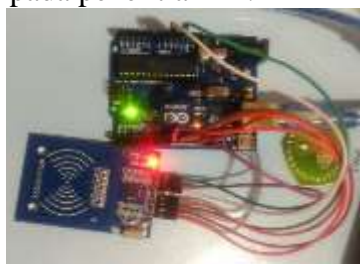
gambar 8 Hasil Rangkaian RFID dan Arduino

Dari pengujian yang dilakukan berdasarkan prosedur pengujian RFID, maka akan diperoleh sampel data hasil pembacaan RFID dari beberapa sumber tag ID yang ditunjukkan pada Tabel 4.3. dan dapat dipastikan pula RFID dapat berfungsi dengan baik untuk pembacaan tag ID dan dapat digunakan pada penelitian ini.