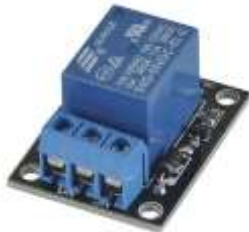
gambar 2 Modul Relay

Relay adalah saklar elektrik yang menggunakan electromagnet untuk memindahkan saklar dari posisi OFF ke posisi ON. Daya yang dibutuhkan untuk mengaktifkan relay relatif kecil. Namun, relay dapat mengendalikan sesuatu yang membutuhkan daya lebih besar.