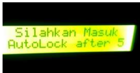
gambar 13 Tampilan AutoLock

Tuas Door Lock memendek karena teraliri listrik sehingga kunci pintu terbuka dan memberikan hak akses untuk masuk.