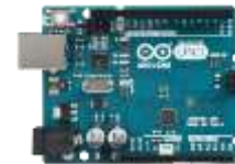
gambar 1 Modul Arduino Uno

Modul Arduino Uno yang telah dijelaskan diatas dapat ditunjukkan pada gambar berikut: