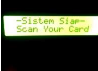
gambar 10 Tampilan sistem siap

Hasil dari skenario 2 yaitu kondisi sistem dalam keadaan siap untuk melakukan scan tag RFID.