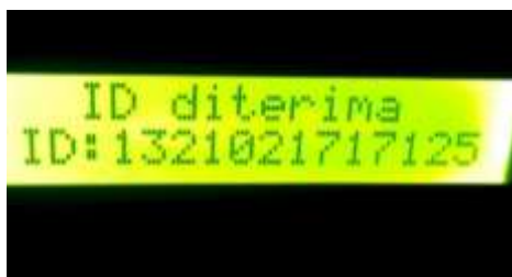
gambar 11 Tampilan ID diterima

Melakukan tag dengan ID yang telah terdaftar akan memberikan hak akses yang ditandai buzzer