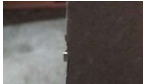
gambar 12 Tuas Door Lock memendek

berbunyi 1 kali dan LCD menampilkan bahwa ID telah diterima.