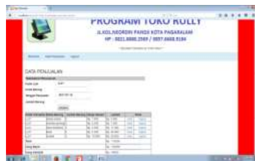
Gambar 18. Halaman Penjualan Kasir

Tampilan ini merupakan halaman kasir yang digunakan oleh untuk melakukan transaksi kepada konsumen.