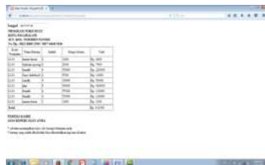
Gambar 19. Tampilan Struk Pembayaran

Tampilan ini adalah halaman proses transaksi penjualan yang dilakukan kasir dengan