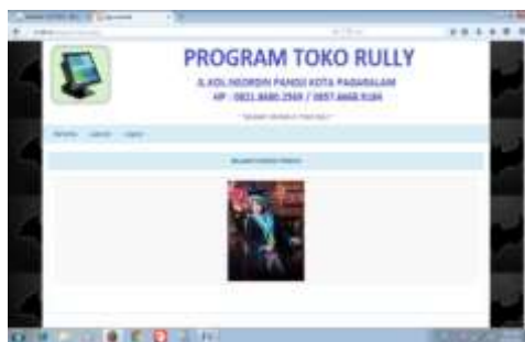
Gambar 15. Halaman Pemilik

Halaman menu ini adalah halaman yang pertama kali dijumpai setelah halaman login sehingga bisa masuk ke menu-menu lainnya.