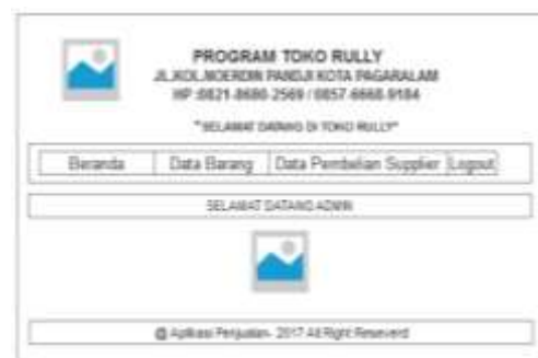
Gambar 4. Tampilan admin

Pada halaman ini admin dapat menggunakan untuk menginput, mengedit, dan menghapus data pada halaman admin .