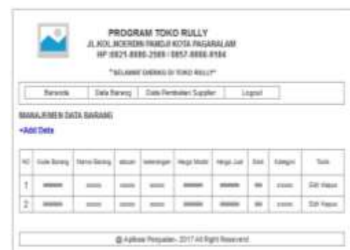
Gambar 5. Desain Data Barang

Pada halaman ini admin bisa menggunakan untuk menginput, mengedit, menghapus data barang pada halaman admin .