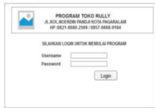
Gambar 3. Desain Menu Login User

Halaman ini merupakan halaman utama, yang di temui oleh user untuk masuk pada sistem dan melakukan login maka akan masuk ke halaman Login ini.