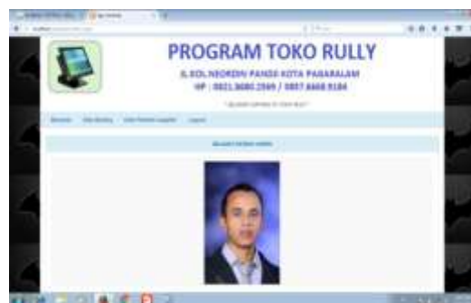
Gambar 11. Tampilan Menu Utama User

Halaman ini akan muncul saat kita membuka sistem maka akan muncul halaman login user .