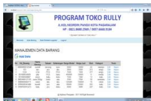
Gambar 13. Halaman Data Barang

Pada halaman ini admin dapat menginput data barang mengedit, menghapus data pada halaman data barang.