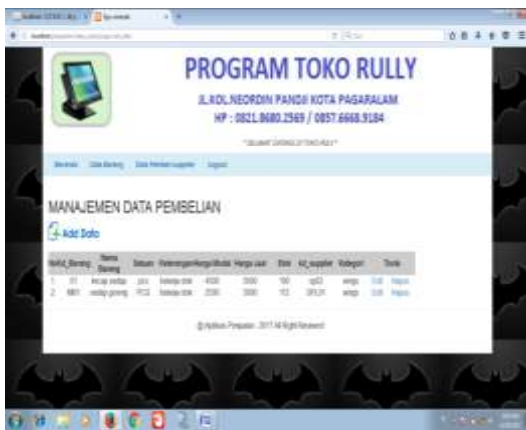
Gambar 14. Tampilan Pembelian Supplier

Pada halaman ini admin menggunakan untuk menginput data pembelian barang mengedit, menghapus data pada halaman pembelian barang.