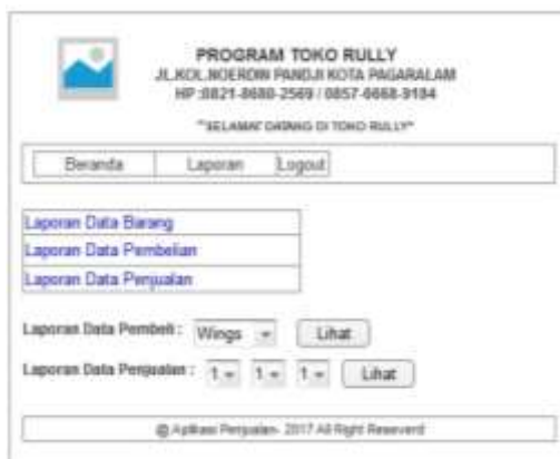
Gambar 8. Tampilan Laporan Pemilik

Desain halaman menu ini adalah halaman yang pertama kali dijumpai setelah halaman login sehingga bisa masuk ke menu lainnya.