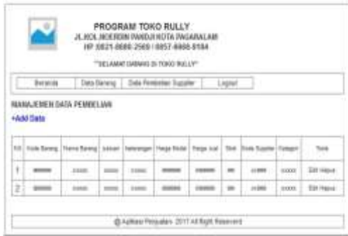
Gambar 6. Desain Menu Supplier

Pada halaman ini digunakan oleh admin untuk menginput, menghapus dan meng edit data pembelian kepada supplier .