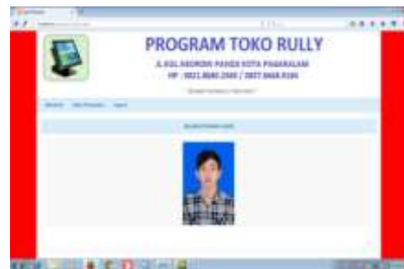
Gambar 17. Halaman Utama Kasir

Halaman menu ini adalah halaman yang pertama kali dijumpai setelah halaman login sehingga bisa masuk ke menu-menu lainnya sebagai kasir untuk memproses penjualan dan melayani transaksi kepada konsumen.