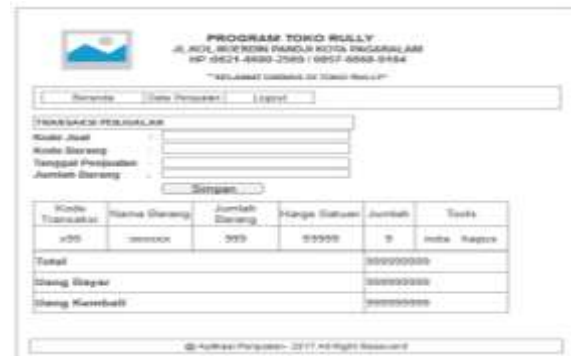
Gambar 10. Tampilan Penjualan Kasir

Pada halaman ini kasir bisa menggunakan untuk menginput data penjualan dalam melayani konsumen dengan menginputkan data barang menggunakan alat barcode sebagai alat penginput data barang.