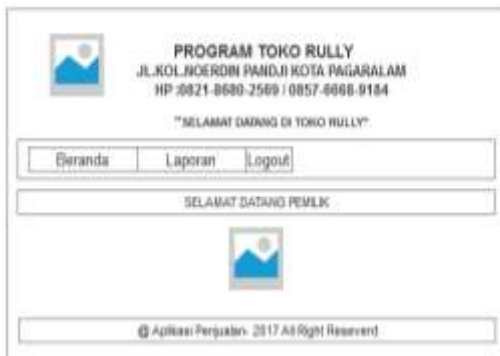
Gambar 7. Tampilan Menu Pemilik

Desain halaman menu ini adalah halaman yang pertama kali dijumpai setelah halaman login sehingga bisa masuk ke menu lainnya.