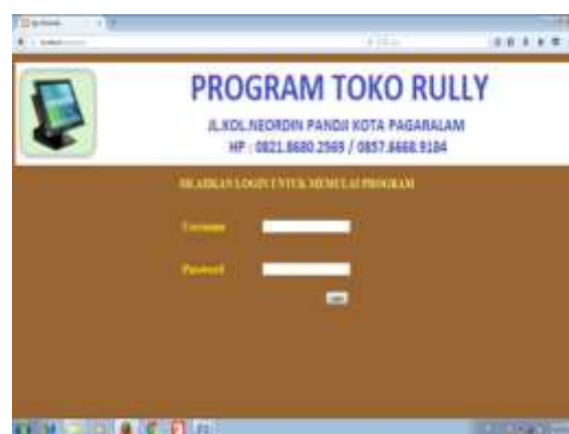
Gambar 12. Halaman Admin

Halaman ini merupakan halaman utama, yang di temui oleh admin setelah admin masuk ke dalam sistem dan melakukan login maka akan masuk ke halaman utama.