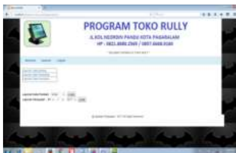
Gambar 16. Tampilan Halaman Pemilik

Pada halaman ini pemilik bisa melihat hasil dari masukan yang telah di lakukan oleh admin dan