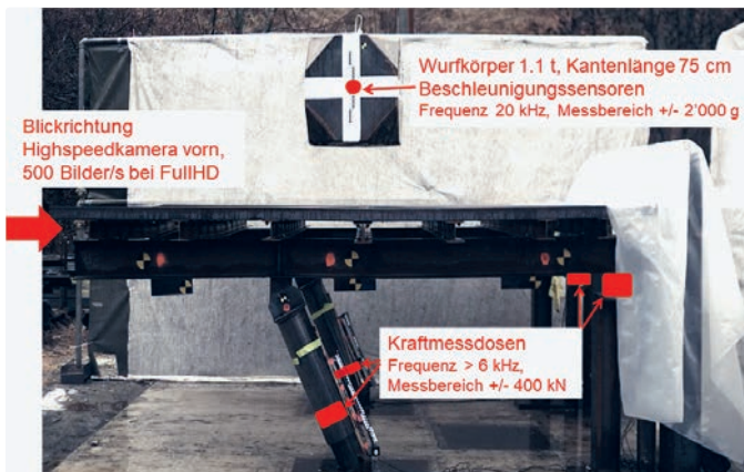
Abb. 2: Seitenansicht Versuchsaufbau und Messtechnik

Lawinverbauungen stehen in alpinem Gelände mit sensibler Flora und Fauna. Die Baustelleneinrichtung und die Baumaterialien werden üblicherweise mit dem Helikopter in die Steilhänge transportiert. Lärm und CO 2 -Ausstoss dieser Transportflüge belasten die Umwelt und die Tierwelt stark. Die neu entwickelte Lawinverbauung bedingt weniger Helikoptertransporte und schont die Umwelt.