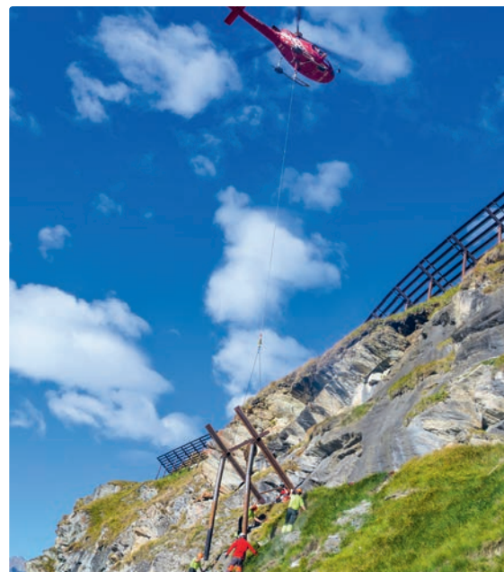
Abb. 4: Montage von zwei Testwerken

Infos zur Wirtschaftspartnerin – krummenacher-ag.ch