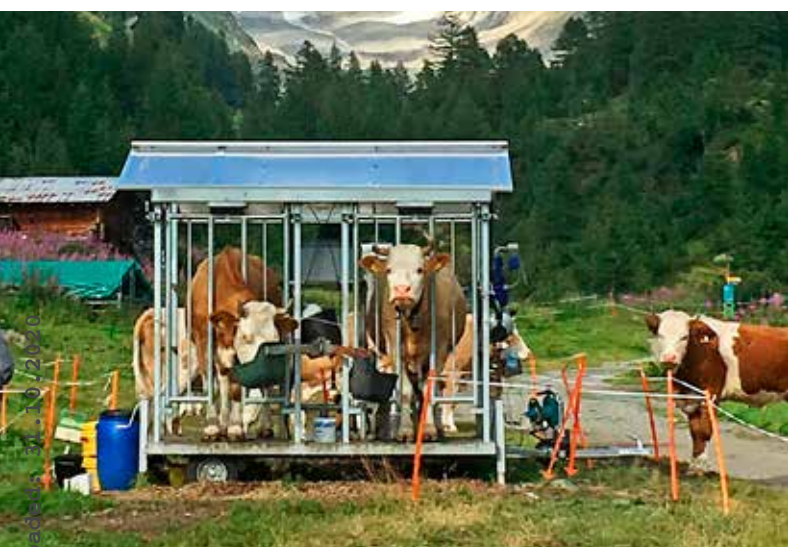
Vaches à deux fins dans une installation de traite mobile à Fafle-alp (VS).

Renseignements: Stefan Probst, e-mail: stefan.probst@bfh.ch