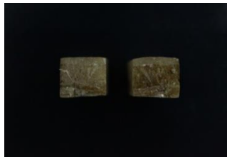
Gambar 3 Patahan campuran serat rotan 30%

Dari gambar 3 yaitu spesimen hasil uji impak metode charpy campuran serat rotan 30% menunjukkan perpatahan campuran dimana merupakan kombinasi antara patahan berserat ( fibrous fracture ) dan patahan granular/kristalin), yang melibatkan mekanisme pergeseran serat yang ulet ( ductile ). Ditandai dengan permukaan patahan berserat yang berbentuk dimpel akan tetapi memberikan daya pantul cahaya yang tinggi.