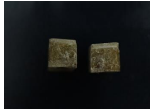
Gambar 4. Patahan campuran serat rotan 40%

Dari gambar 4 yaitu spesimen hasil uji impact metode charpy campuran serat rotan 40% menunjukkan perpatahan berserat ( fibrous fracture ), yang melibatkan mekanisme pergeseran serat yang ulet ( ductile ). Ditandai dengan permukaan patahan berserat yang berbentuk dimpel yang menyerap cahaya dan berpenampilan buram.