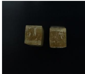
Gambar 2. Patahan campuran serat rotan 20%

Dari gambar 2 yaitu spesimen hasil uji impak metode charpy campuran serat rotan 20% menunjukkan perpatahan granular/kristalin yang dihasilkan oleh mekanisme pembelahan ( cleavage ) pada bahan dari serat yang rapuh ( brittle ). Ditandai dengan permukaan patahan yang datar yang mampu memberikan daya pantul cahaya yang tinggi (mengkilat).