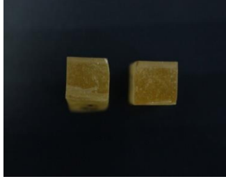
Gambar 1. Patahan tanpa campuran serat rotan

Dari gambar 1 yaitu spesimen hasil uji impak metode charpy tanpa campuran serat rotan menunjukkan perpatahan granular/kristalin yang dihasilkan oleh mekanisme pembelahan ( cleavage ) pada butir-butir dari bahan yang rapuh ( brittle ). Ditandai dengan permukaan patahan yang datar yang mampu memberikan daya pantul cahaya yang tinggi (mengkilat).