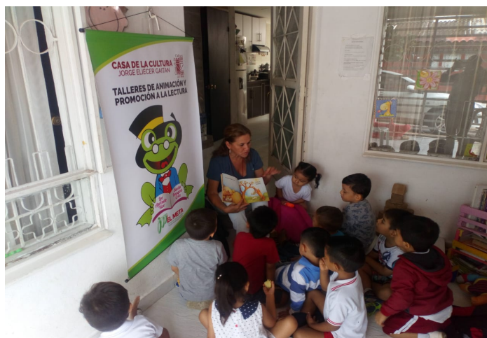
Ilustración 2. Hogar Infantil Mis Travesuras – Lectura del Cuento El Patito Feo de Hans C. Andersen.

La reflexión que el cuento del patito feo deja a cada uno de los niños es que siempre debemos de ayudarnos entre todos sin importar nuestra apariencia, partiendo del cuento cada uno de los niños dio su punto de vista acerca de la lectura, contando algún suceso que haya vivido o visto como por ejemplo ¡Yo le presto los juguetes a mi hermano, a mi primo o a mi amigo!, ¡Yo no peleo con mis amigos!, ¡Yo si comparto mis juguetes!, etc. esta es la forma en que los niños nos expresaban las diferentes maneras en las que entendían el mensaje del libro, creando en ellos un compromiso de amistad sellado mediante un abrazo.