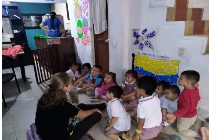
Ilustración 3. Hogar infantil Armonía – Lectura del cuento Rin Rin Renacuajo.

Es de resaltar que los textos que se aplicaban con los niños y niñas, se familiarizaban con base a su cotidianidad, de esta manera hacía más recíproca su lectura. Teniendo en cuenta, aspectos importantes como La ley 115 en 1994, donde en su artículo 23 señala que la lengua castellana, humanidades e idioma extranjero como un área obligatoria fundamental, además hace notar la importancia que ésta tiene desde los primeros grados de escolaridad, iniciando de los grados de preescolar donde se deben brindar los primeros conceptos, ya que esta crea bases primordiales para su desarrollo cognitivo. 43