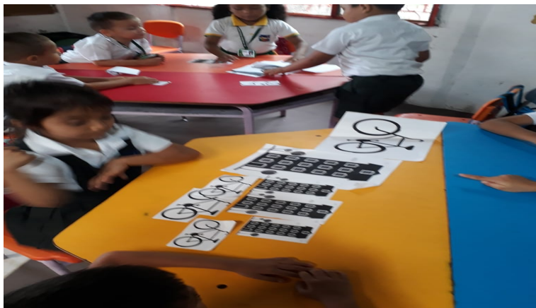
Ilustración 2. Actividad de clasificación por tamaño en forma ascendente y descendente. 2018.