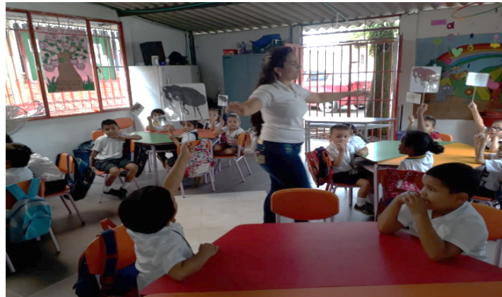
Ilustración 1. Actividad Conociendo Unas Pulguitas. 2018.

elementos, cuantificaron los de una clase, por medio del conteo, visualizaron un objeto físico de forma independiente a la clase que pertenecía y por último manifestaron de manera verbal las clases que habían estructurado mentalmente.