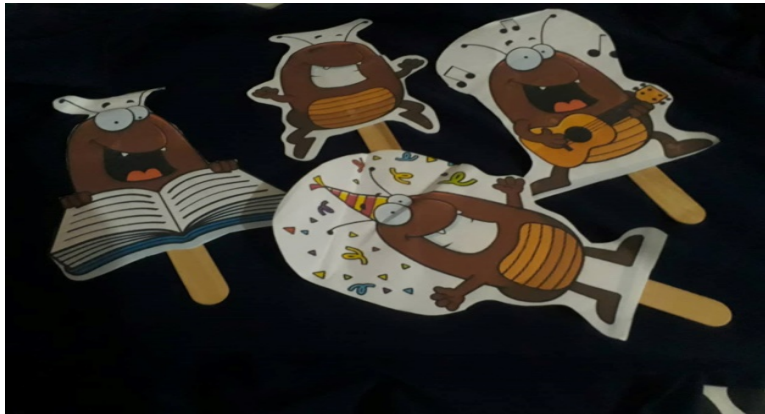
Ilustración 4. Materiales de la actividad “Teatro De Las Pulgas. 2018.