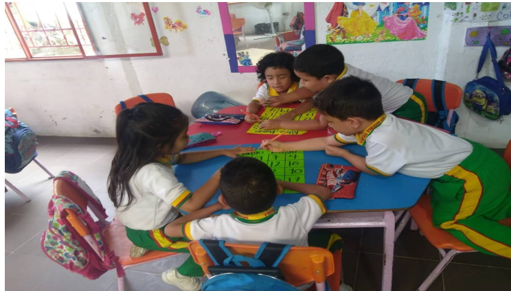
Ilustración 5. Actividad “Bingo”. 2018.