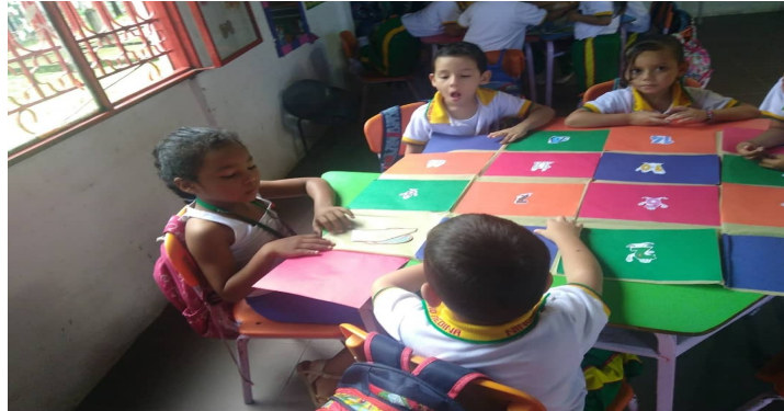
Ilustración 6. Actividad “Concentra-dos”. 2018.