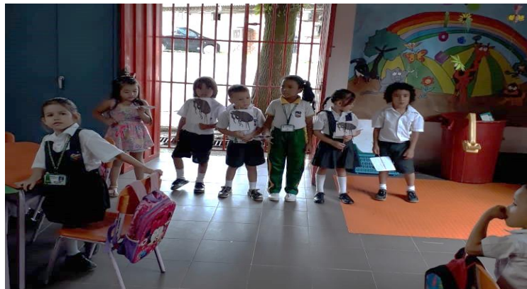
Ilustración 3. Realizando conteo por orden de tamaño. Grande - Pequeño. 2018.

elementos de una colección a otra. Como se evidenció en esta actividad donde los escolares se cuestionaron sobre el tamaño de los objetos que manipulan y tuvieron que establecer el objetos más grande como referente para que ante un nuevo elemento lo ubicaran correctamente en la escala, esta noción trae implícita la esencia de la escala numérica.