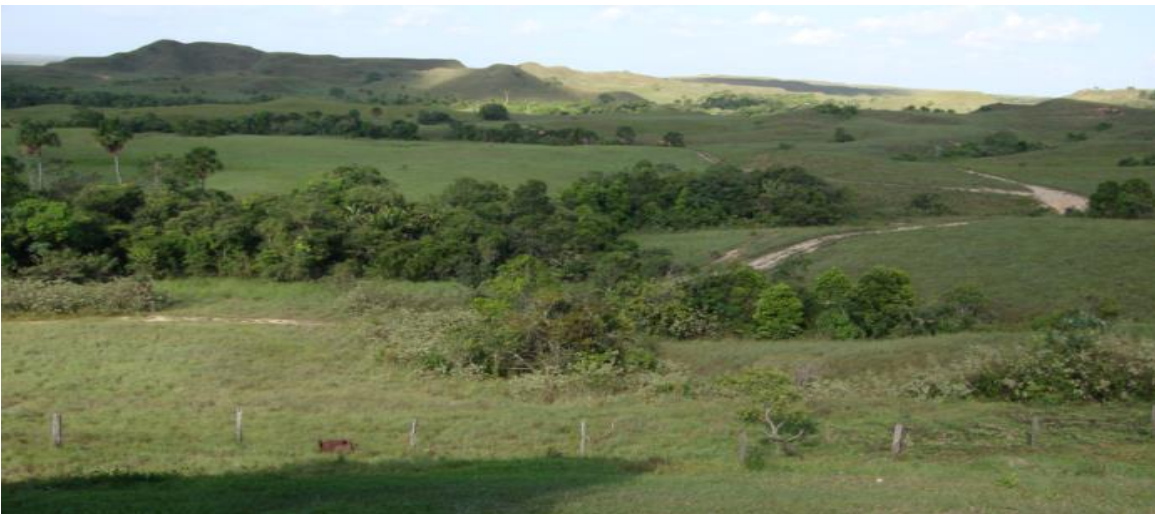
Imagen 1. Paisaje de Serranía

Toda la finca está ubicada sobre un terreno ondulado denominado Serranía, el cual tiene como característica la presencia de zonas bajas formados por valles y parte altas formando pequeñas lomas, presenta una cobertura de pastos de sabana (Guaratara) los cuales se secan en época de verano.