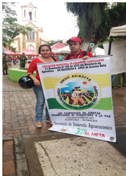
ENTREGA DEL PENDÓN A LA ANUC