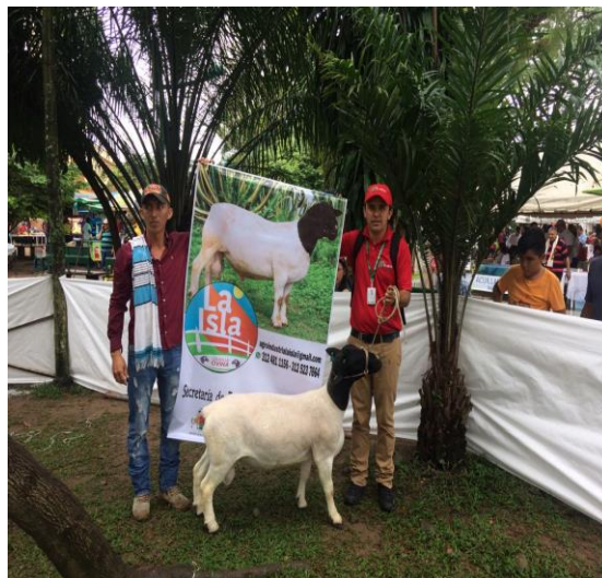
LA ISLA