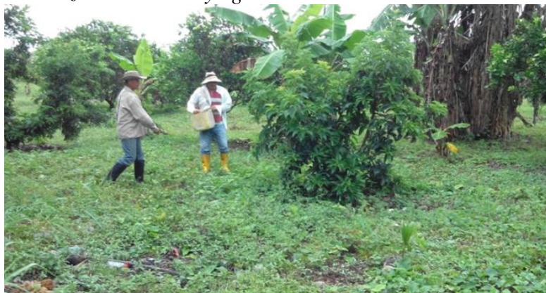
Ilustración 14: Fertilización cítricos y aguacate