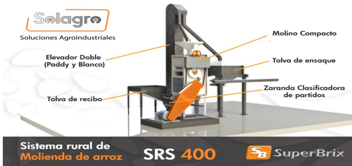
Ilustración 8: Molino de arroz

El proyecto está basado en la entrega de equipos de transformación como lo es en este caso la entrega de la trilladora de Arroz, desgranadora de Maíz y moto cargueros como medio de transporte, elementos y equipos para el empaclado, para cada una de las asociaciones.