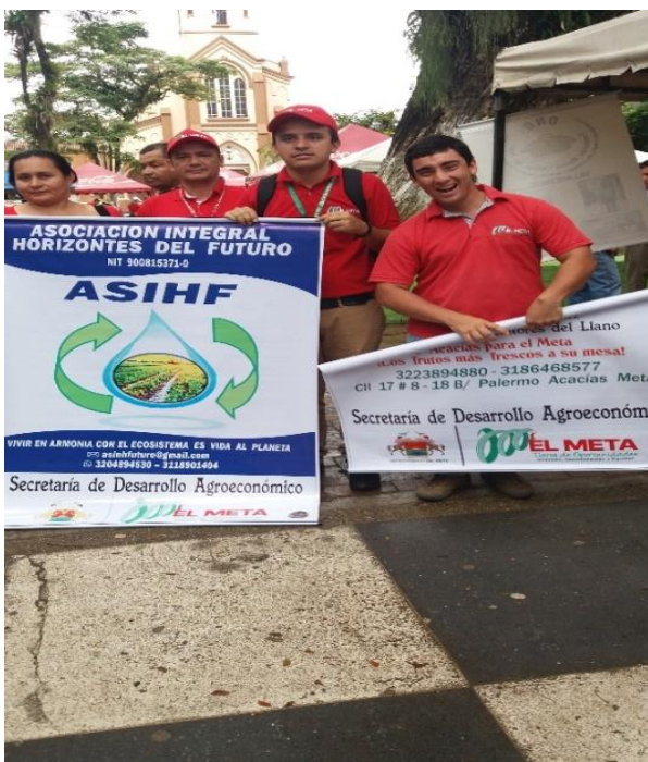
ENTREGA DE PENDÓN A ASIHF