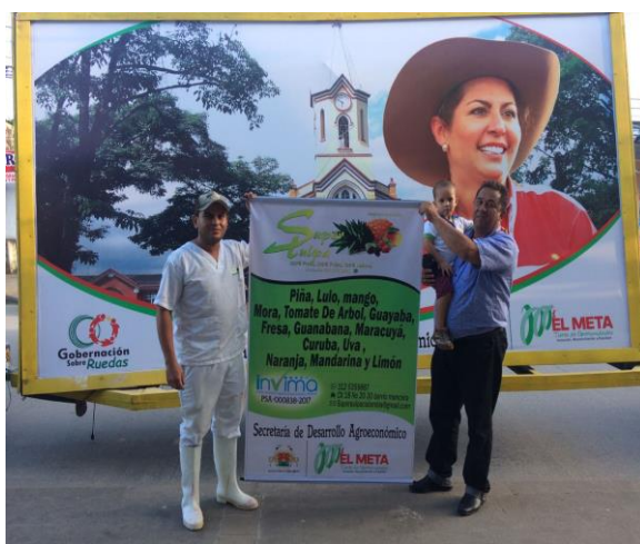
SUPER PULPA