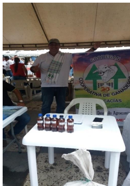
ENTREGA DEL PENDÓN A COODEGA