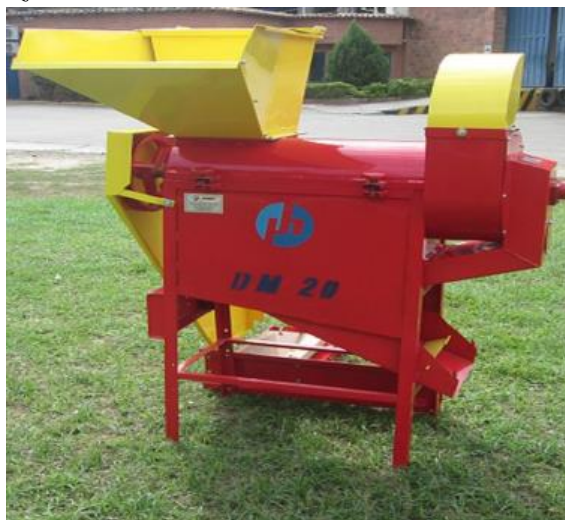
Ilustración 9: Desgranadora de Maíz