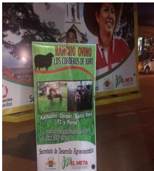
RANCHO OVINO