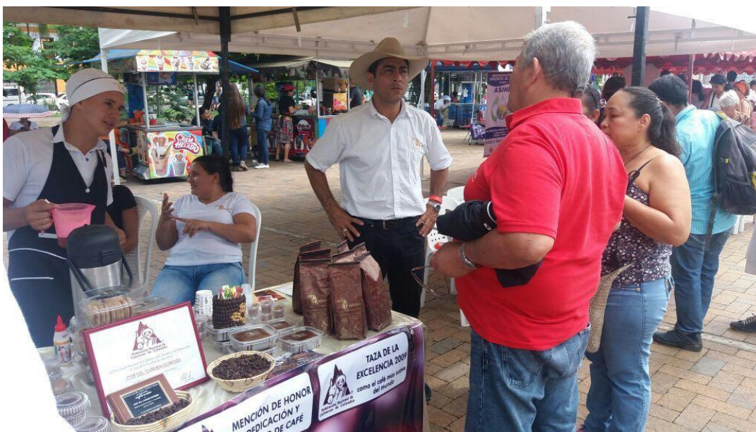
STAND DE PRODUCTOR PARTICIPANTE.- Fuente: propia