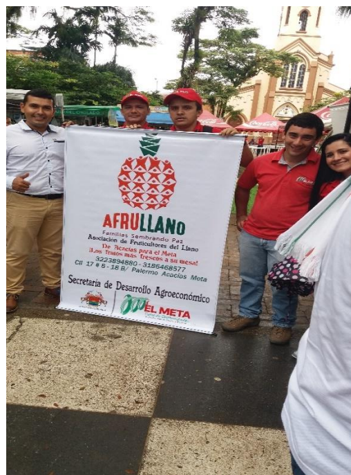
ENTREGA DE PENDÓN A AFRULLAN