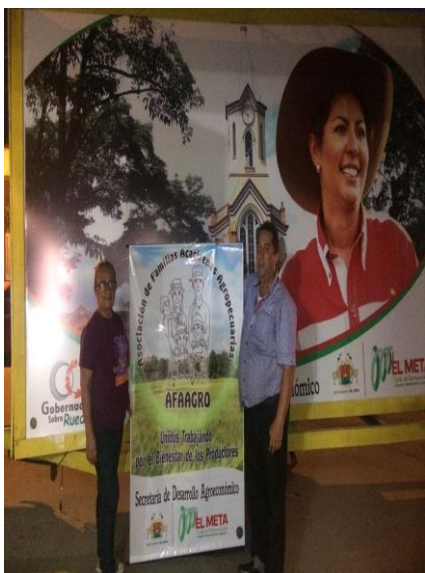
AFAAGRO Fuente: propia