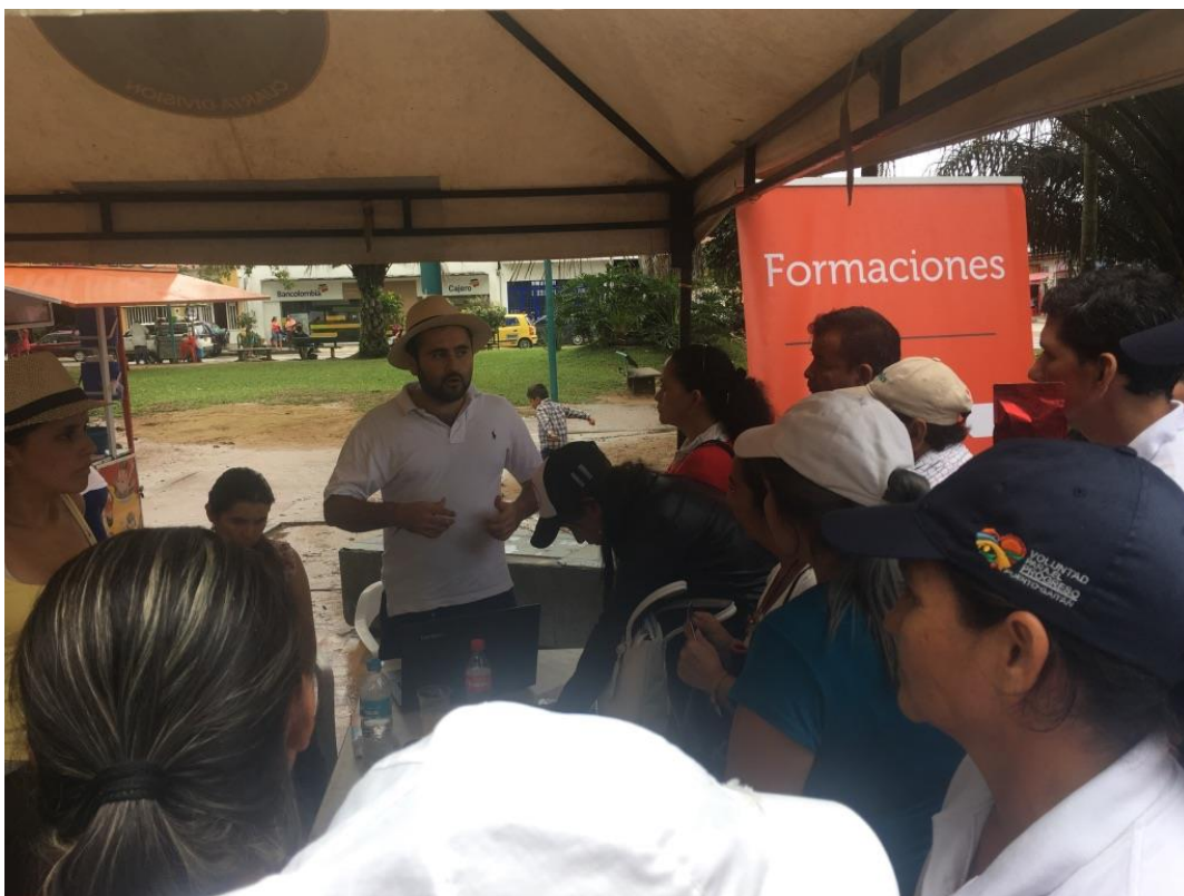
REGISTRÓ PARA EL GLN A PRODUCTORES POR PARTE DE LOGYCA