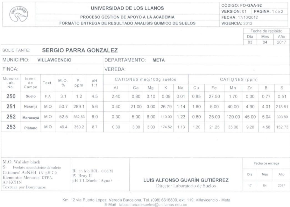
Ilustración 4. Análisis químico de suelo y los bio-carbón de maracuyá, plátano y naranja.