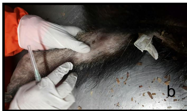
Figura 5. (a) Venopunción en la vena cefálica en el miembro anterior izquierdo para la obtención de la muestra. (b) Venopunción de la vena safena en el miembro posterior izquierdo.

Se evaluaron los parámetros hematológicos correspondientes a recuento de eritrocitos (RGR M/mm 3 ), hematocrito (Hto %), hemoglobina (HB; g/dl), volumen corpuscular medio (VCM), hemoglobina corpuscular media (HCM pg), concentración de hemoglobina corpuscular media (CHCM g/dl), Leucocitos (RGB 10/mm 3 ), Neutrófilos