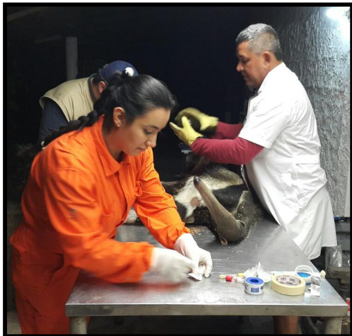
Figura 3: Valoración clínica del animal – morfometría

Esta información fue tabulada y consignada en una tabla de registro diseñada para este estudio en Excel 2010.