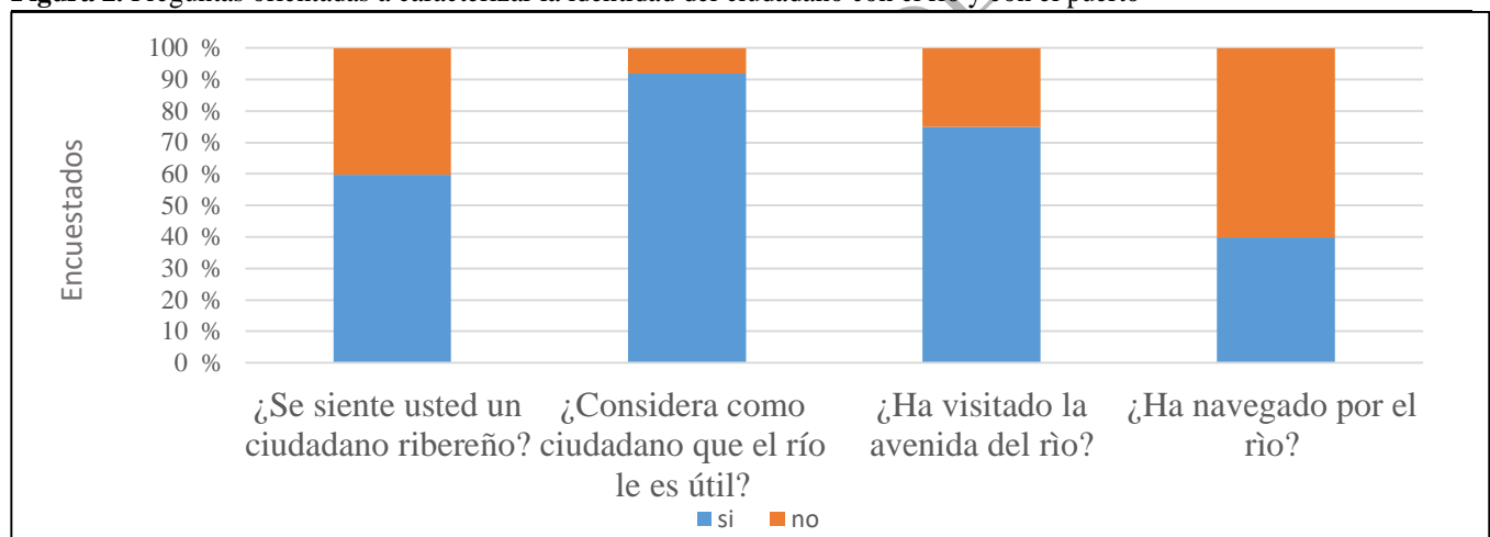
Figura 2. Preguntas orientadas a caracterizar la identidad del ciudadano con el río y con el puerto

El 91,8 % lo ve útil, argumentando beneficios en las actividades económicas de transporte de mercancías y como abastecedor de agua potable para la ciudad de Barranquilla; de este 91,8 %, sólo un 5,8 % reconoce un uso turístico del río.