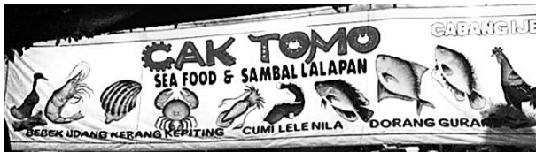
Gambar 6. Ujicoba keterbacaan dan kejelasan dengan memakai monochrome mode dari desain Ilustrasi dan Tipografi Warung Lalapan Cak Tomo

Selanjutnya, pada tenda warung Lalapan Cak Tomo, karena ukuran form tenda yang memanjang, maka dapat dimanfaatkan untuk menyampaikan pesan lebih banyak. Dapat dilihat, Cak Tomo menampilkan banyak sekali elemen grafis tanpa takut kejelasan dan keterbacaannya turun, karena memang ukuran media yang dipakai lebih besar. Dengan menggunakan backgroud putih, ilustrasi dan tipografi yang dipakai memakai warna-warna yang kontras sehingga dengan mudah diidentifikasi dan dilihat dari jarak jauh. Ukuran media yang besar serta pencahayaan yang cukup juga mendukung kejelasan spanduk Cak Tomo. Bila diuji dengan warna monochrome pun, spanduk warung Cak Tomo masih cukup jelas kontrasnya. Hal ini dapat dilihat dari percobaan dengan mengubah desain menjadi black and white monochrome mode.