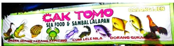
Gambar 4. Urutan informasi (sequence) dari desain Ilustrasi dan Tipografi Warung Lalapan Cak Tomo

Sedangkan pada gambar 4 yaitu Warung Tenda Lalapan Cak Tomo, sequence informasi yang menjadi pusat perhatian adalah tulisan Cak Tomo, dengan ukuran huruf yang lebih besar dari huruf yang lain, serta menggunakan klasifikasi huruf sans serif ornamental. Typeface berwarna magenta, dengan menggunakan bayangan warna hitam sehingga menjadi sangat kontras dengan latar belakang kain yang berwarna putih. Ilustrasi yang digunakan juga lebih banyak, yaitu gambar bebek, udang, kerang, kepiting, cumi, lele, nila, dorang, gurami, dana yam, karena memang pilihan menu di warung ini lebih banyak. Di bawah ilustrai hewan-hewan tersebut, ditambah tulisan nama-nama hewan yang bersangkutan untuk memperkuat dan memperjelas kandungan pesan, berupa menu-menu yang disediakan oleh Warung Lalapan Cak Tomo. Sequence pesan yang termuat dalam ilustrasi warung Lalapan Cak Tomo adalah sebagai berikut: