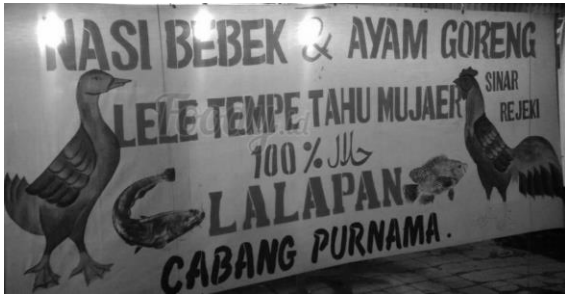
Gambar 5. Ujicoba keterbacaan dan kejelasan dengan memakai monochrome mode dari desain Ilustrasi dan Tipografi Warung Lalapan Cabang Purnama

Selanjutnya, pada tenda warung Lalapan Cak Tomo, karena ukuran form tenda yang memanjang, maka dapat dimanfaatkan untuk menyampaikan pesan lebih banyak. Dapat dilihat, Cak Tomo menampilkan banyak sekali elemen grafis tanpa takut kejelasan dan keterbacaannya turun, karena memang ukuran media yang dipakai lebih besar. Dengan menggunakan backgroud putih, ilustrasi dan tipografi yang dipakai memakai warna-warna yang kontras sehingga dengan mudah diidentifikasi dan dilihat dari jarak jauh. Ukuran media yang besar serta pencahayaan yang cukup juga mendukung kejelasan spanduk Cak Tomo. Bila diuji dengan warna monochrome pun, spanduk warung Cak Tomo masih cukup jelas kontrasnya. Hal ini dapat dilihat dari percobaan dengan mengubah desain menjadi black and white monochrome mode.