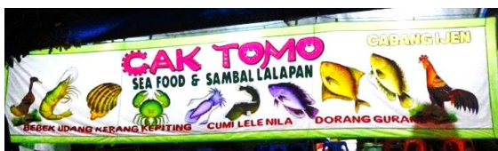
Gambar 2. Desain Ilustrasi dan Tipografi Warung Cak Tomo Sea Food & Sambal Lalapan, Jl. Ijen, Malang (Seberang Gereja Ijen)

Warung tenda Lalapan Cabang Purnama mudah kita jumpai di beberapa Titik di Kota Malang. Ada 30 cabang warung lalapan yang sekarang beroperasi di Kota Malang. Desain ilustrasi tendanya memiliki ciri khusus yang memudahkan pelanggan mengidentifikasinya. Warung ini hanya buka sore sampai dengan 17.00 WIB – 23.00 WIB. Menu yang ditawarkan antara lain ayam goreng, lele, Mujair, dan ikan yang semuanya ditam (semacam olahan p goreng). Menurut Ch (media online) warung tenda cabang disediakan tidak semuanya di buat ilustrasi tenda. Hanya maksimal empat menu yang digambar ada tenda. Warung lalapan Purnama lebih fokus pada pesan tulisan (tipografi) serta warna tenda sebagai sarana identitas dan komunikasi pada para pelanggannya.