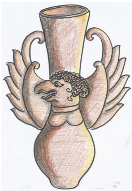
Gambar Sketsa alternatif desain 5