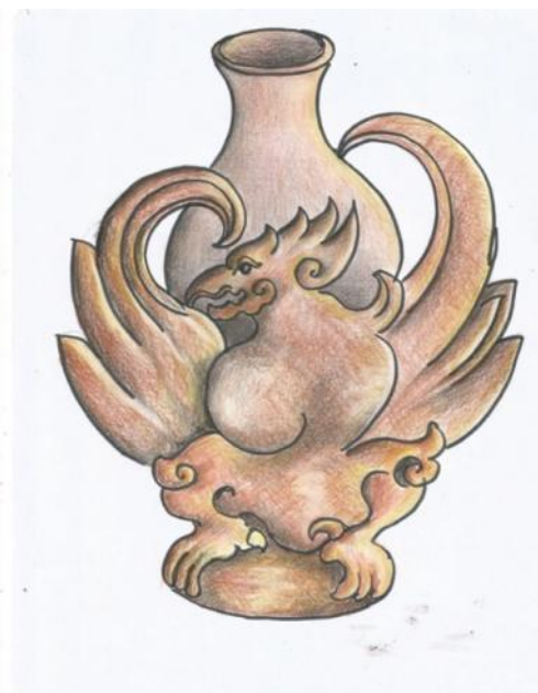
Gambar sketsa alternatif desain 4