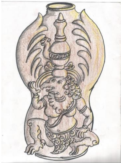
Gambar sketsa alternatif desain1

Hasil pradesain atau gambar stetsa alternatif desain bertema “ Kendi hias Garuda Kamandalu candi Kidal”.