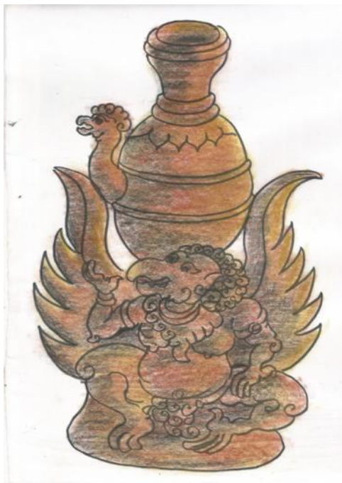
Gambar sketsa alternatif desain 3