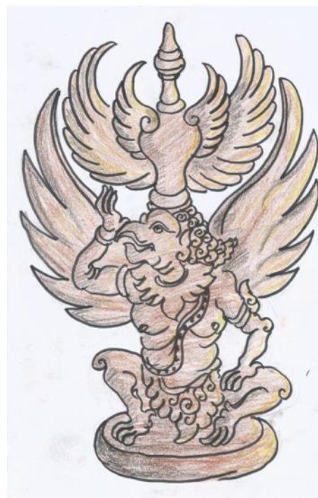
Gambar sketsa alternatif desain 6

Hasil gambar sketsa alternatif selanjutnya dipilih berdasarkan pertimbangan teknis, artistik, dan ekonomis untuk diwujudkan menjadi gambar desain. Pemilihan terhadap gambar sketsa alternatif yang berupa gambar pradesain produk keramik dilakukan dengan