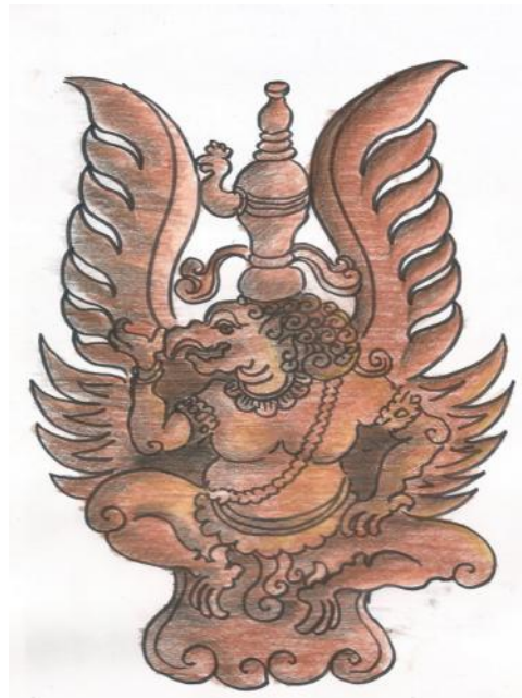
Gambar sketsa alternatif desain 2