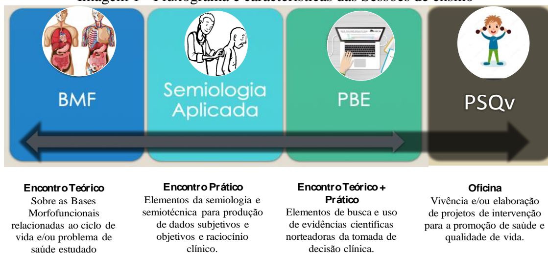
Imagem 1 - Fluxograma e características das Sessões de ensino

O planejamento das sessões é feito semestralmente, a partir da escolha de um tema que orientará as sessões de cada mês, seguindo a sequência apresentada na imagem 1.