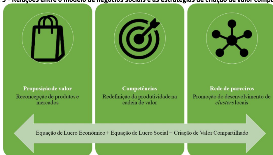
Figura 3 - Relações entre o modelo de negócios sociais e as estratégias de criação de valor compartilhado

Esta subseção se propõe a explicitar as possíveis relações entre as dimensões que compõem a base do modelo sociais proposto por Petrini et al. , (2016) e as estratégias de criação de valor compartilhado propostas por Porter e Kramer (2011). Tais relações são representadas na Figura 3.