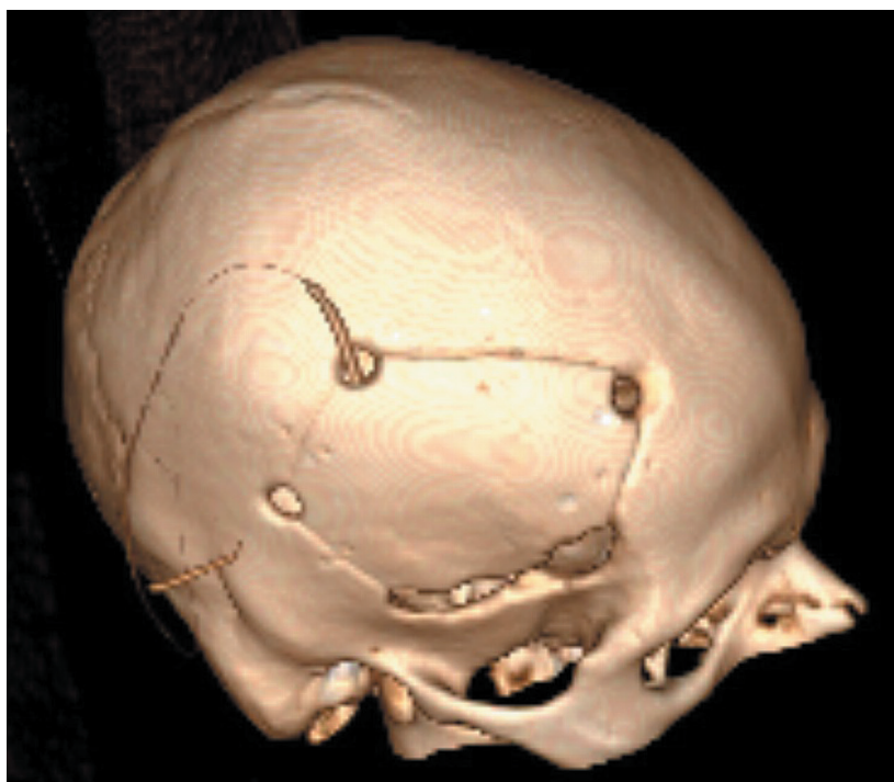
Рисунок 1. Компьютерная томография пациента после операции в 3D-реконструкции Figure 1. Postop CT scan, 3D reconstruction Краниопластика выполненная аутокостью. Аутокость хранилась в морозильной камере.

Наиболее широкое распространение для реконструктивной нейрохирургии приобрели ксеноимплантаты (материалы небиологического происхождения) [13, 14]. Полиметилметакрилаты (РММА) . Эта группа располагает рядом достоинств, хорошо известных и широко применяемых большей частью нейрохирургов: легкость в моделировании имплантата любой конфигурации и размеров, относительно низкая стоимость [20]. Невзирая на широкое распространение, с ними сопряжен сравнительно высокий риск возникновения осложнений в постоперационном периоде. Местные воспалительные реакции сопряжены с токсическим и аллергическим эффектом РММА [21, 22]. Пластина, полученная из пресс-формы, таит в себе погрешности в восстановлении косметического вида, из-за