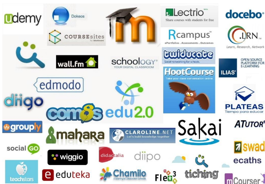
Fig. nº 1. Plataformas educativas estandarizadas de uso gratuito disponibles

Aunque existen diferentes plataforma educativas estandarizadas de uso gratuito disponibles en la red (véase la figura número 1) como son Claroline, Dokeos, Ilias, Edmodo, Fle3, Moodle, etc., en los centros de secundaria se utiliza el Aula XXI que es una plataforma de aprendizaje basada en Moodle que ofrece servicio a los centros de la Región de Murcia.