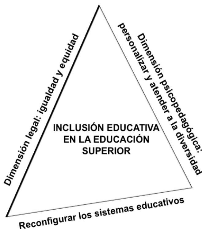
Fig. nº 1. Dimensiones de enfoques inclusivos en la educación superior