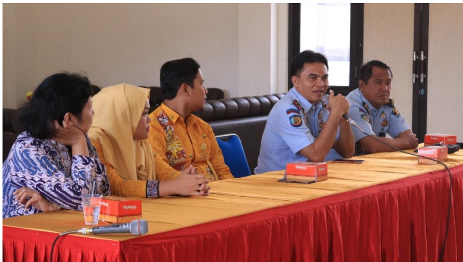
Gambar 2. Sambutan Kepala Lapas Terbuka Kelas IIB Kendal

Hasil kegiatan yang merupakan program pengabdian tahap selanjutnya adalah focus group discussion (FGD) dan workshop literasi keuangan bagi warga binaan dan pegawai lapas. Kegiatan ini dilakukan pada hari Kamis, 18 Juli 2019. Hal ini dilakukan mengingat kesepakatan dan kesesuaian jadwal tim pengabdian dengan kepala bagian pembinaan lapas terbuka kelas IIB Kendal. Kegiatan diselenggarakan mulai pukul 08.00 WIB sampai dengan pukul 13.00 WIB, di gedung serbaguna kawasan pembinaan lapas produktif dan dibuka langsung oleh kepala Lembaga Perasyarakatan Terbuka Kelas IIB Kendal (Gambar 1). Kegiatan ini dihadiri oleh tim pengabdian kepada masyarakat fakultas ekonomi dan pegawai lapas terbuka kelas IIB Kendal serta warga binaan. Total peserta 60 orang.