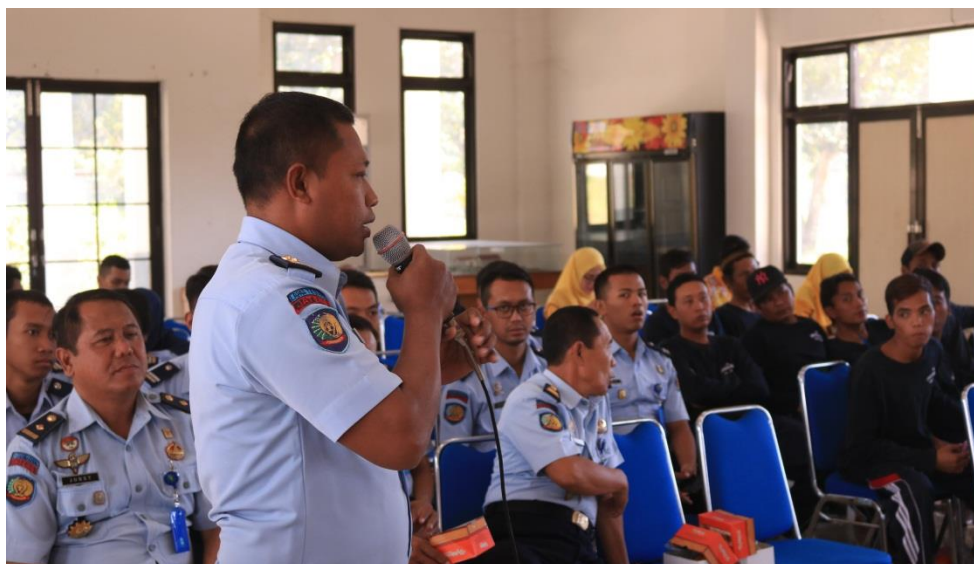
Gambar 5. Diskusi dan Tanya Jawab Workshop