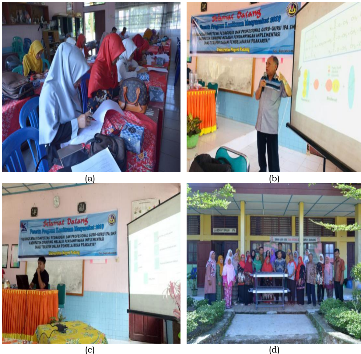
Gambar 1. Dokumentasi kegiatan pembekalan materi pendampingan sains terapan dalam pembelajaran prakarya (a) pretes, (b) pembekalan materi tentang hidroponik dan biodiesel, (c) pembekalan materi tentang prakarya dan lembar kerja siswa, (d) penyerahan model hidroponik kepada SMP Negeri 11 Sijunjung

nutrisi A dan B, rockwool, TDS, bibit kangkung dan bibit sawi. Kegiatan pembekalan ini dilaksanakan pada hari Sabtu tanggal 13 Juli 2019 di SMP Negeri 11 Sijunjung.