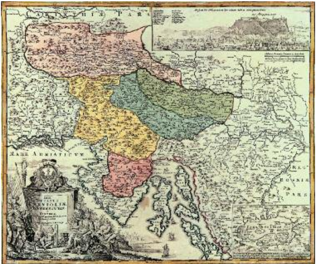
Figure 1: Section from Tabula Ducatus Carnioliae (Map of the Duchy of Carniola), which was created by Johann Baptist Homann (1664–1724) following Valvasor's model, showing four parts of the duchy as well as Istria: Upper Carniola ( Ober Crain ), Inner Carniola ( Inner Craen ), Central Carniola ( Mittel Crain ), and Lower Carniola ( Unter Crain ).

Gams (1996) stated that »scientific regional geography began to develop in the second half of the nineteenth century based on the finding that geographical features on the Earth's surface are genetically and spatially connected. According to this understanding, the main role of regional geography is not to describe the spatial extension of geographical features, but to establish their typical connections in specific parts