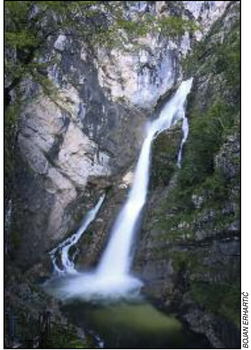
Figure 1: Savica has great cultural value.

state importance and local importance. In Slovenia valuable natural features are divided according to their importance into two groups (local and national). The criteria for such classification differ depending on the category of the natural monument in question, as they are in direct correlation with the characteristic of a particular natural monument and the reason for its protection (Peterlin and Sedej 1965).