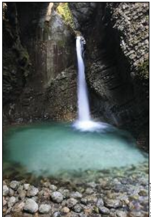
Figure 3: Kozjak waterfall is known for its attractive location.

The comparison includes only the central, quantitative part of each method regarding the proposed evaluation criteria. Introductory parts (general data), as for example the coordinates of the cartographic and archival materials, altitude, etc, were left out of our analysis. Since introductory parts are intended for the broader selection of heritage, and are therefore already at our disposal, we based our research on