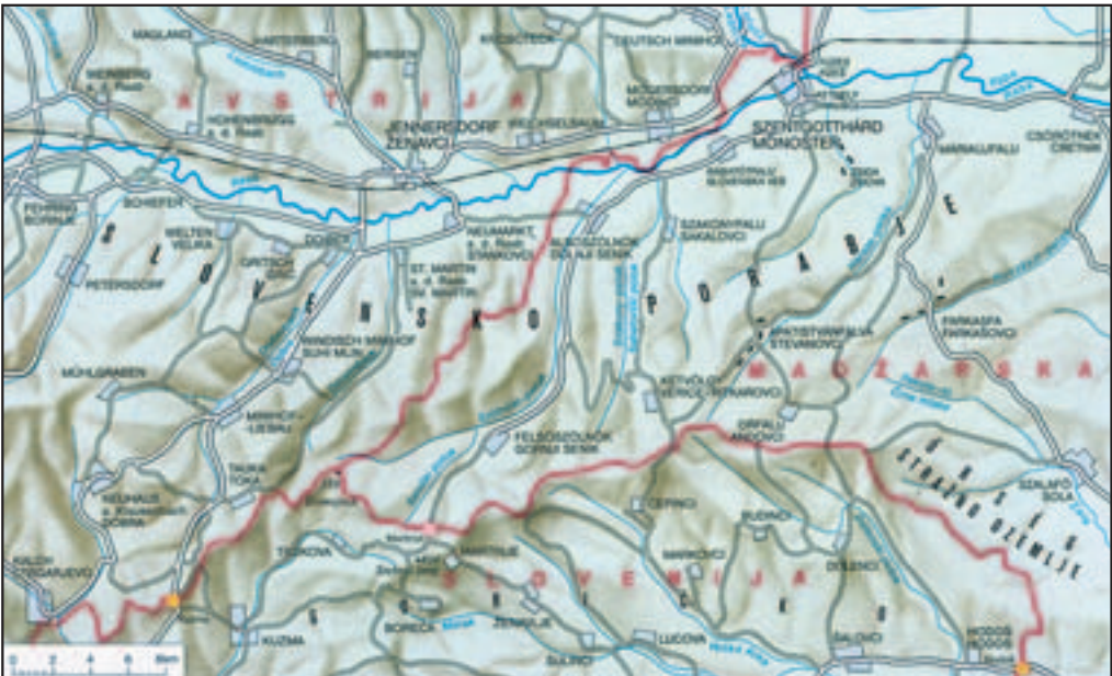
Figure 3: Geographical names in the ethnically Slovenian Rába Valley; many settlements in the Austrian state of Burgenland also have Slovenian names (Kozar-Mukić 1998).

In addition, there are characteristic Slovenian endonyms in the southern part of the Austrian states of Carinthia ( Kärnten ) and Styria ( Steiermark ; Furlan et al. 2008): Bad Eisenkappel/ Železna Kapla , Bad Radkersburg/ Radgona , Bleiburg/ Pliberk , Eibiswald/ Ivnik , Ferlach/ Borovlje , Globasnitz/ Globasnica , Hermagor/ Šmohor , Leutschach/ Lučane , Villach/ Beljak , and Völkermarkt/ Velikovec .