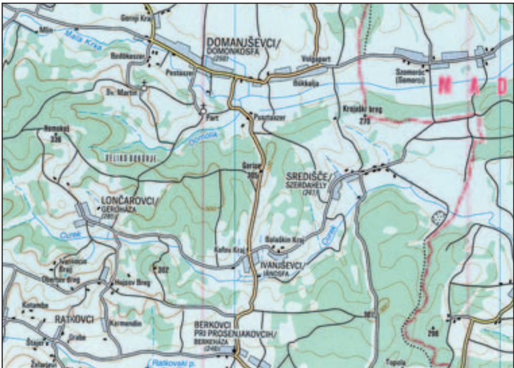
Figure 6: Although official bilingualism was abandoned over a decade ago in the Prekmurje settlements of Lončarovci, Ivanjševci, and Berkovci pri Prosenjakovcih, they are still written in bilingual form in the latest edition of the Slovenian Atlas (Atlas Slovenije 2005).

After the Second World War, the Germans in the Kočevje region officially no longer existed. Many settlements were completely destroyed, and the names of the others were Slovenianized. Nonetheless, a strong German influence can still be recognized in their names (Internet 6). Thus Göttenitz (originally a Slovenian name) became Gotenica, Gottschee Kočevje, Handlern Handlerji, Hasenfeld Zajčje Polje, Lienfeld Livold, Moos Mlaka pri Kočevski Reki, Reichenau Rajhenav, Schalkendorf Šalka vas, Stalzern Štalcerji, and Zwischlern Cvišlerji. Because this involves ethnic and temporal discontinuity, the question arises whether