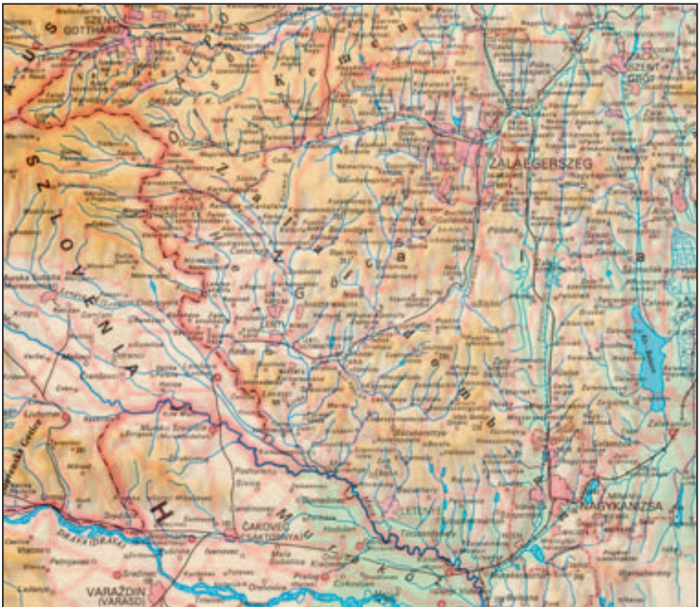
Figure 10: In the same atlas (Cartographia Világtatlasz 1995), the exonymic settlement names Muraszombat and Lendva appear on a more detailed map of Hungary and neighboring Prekmurje; they are written in parentheses.

Although the Hungarians are not excessively interested in the territory of most of Slovenia, which was once in the Austrian part of the empire, the situation is entirely different regarding toponyms in Prekmurje, which was part of the Hungarian half of the empire until 1918. At that time the names of all places were either monolingual Hungarian or bilingual Hungarian/Slovenian, and so it is understandable to some