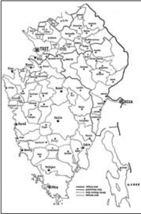
Figure 2: Administrative division of Istria, 1926–1945 (Čermelj 1945; Darovec 1992, 59), for the Municipality of Piran it applies until 1947 when the Free Territory of Trieste was established.

salt has been due to extreme quality of petola crystal clear, white and of fine taste, without any addition of sand and other impurities. Because of very high quality, »white gold« was sold further inland as well as to the rest of Europe and even the Middle East (Bonin 2001). Piran's economic development was based on production and trade in »white gold« for centuries. When Piran accepted Venetian authority as the last town in Istria in 1283, it became a part of the Venetian effort for establishing monopoly over the salt trade (Holz 2001).