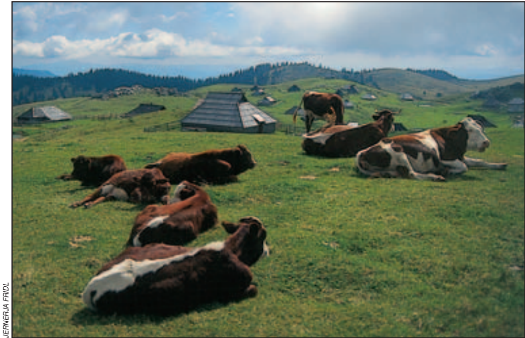
Figure 2: Velika planina (Big Pasture), a rugged karst plateau on the south side of the Kamnik-Savinja Alps, is Slovenia's largest mountain pasture. Its common land may be used by more than 150 grazing-rights holders from the settlements below the southern edge of the pasture.

registers. It is used to determine the levels of subsidies for agricultural land (Lipej 2001). The data sources are digital orthophoto maps at a scale of 1 : 5,000, which are based on black-and-white aerial photographs at a scale of 1 : 17,500 and field verification.