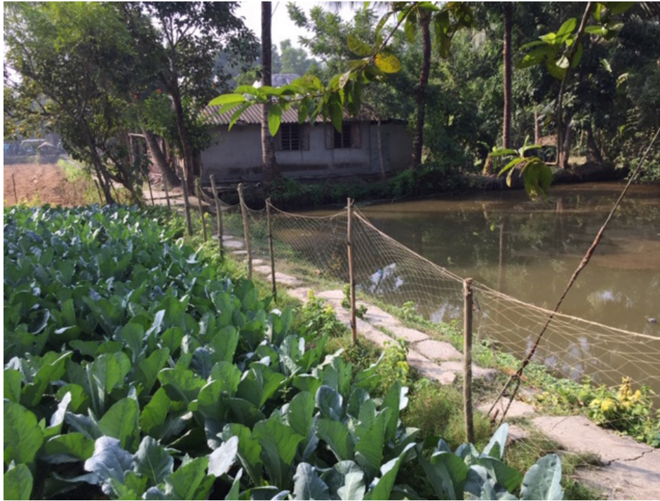
Figure 2. Example of a storage pond in Sundarbans, providing water for domestic task and for irrigating an adjacent vegetable garden.