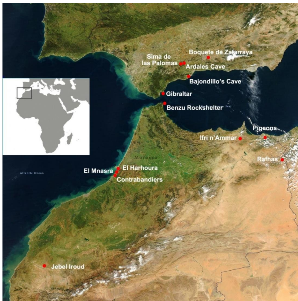
Figura 1. Mapa de localización con los sitios mencionados en el texto.

incluyen las primeras estribaciones de la región como Anyera. Esta región es rica en sílex, radiolaritas y areniscas compactas 31 .