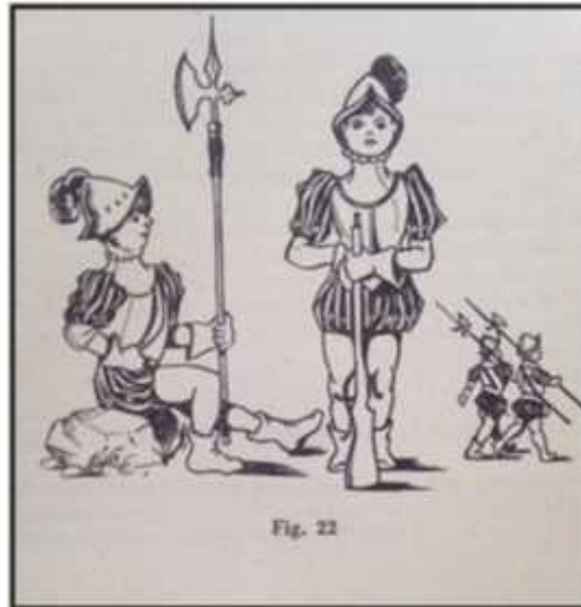
Figura 1: Juego contado de Otumba, Cartilla escolar de Educación Física , 93.

El trípede cuerpo-mente-moral era la base para el adoctrinamiento físico y emocional en el espacio escolar. Como se ha señalado, la moral aparece como un tercer elemento, rompiendo la dialéctica mente-cuerpo , es decir, el trabajo sobre el lo físico y lo intelectual en la escuela, al igual que en las actividades extraescolares, no era suficiente; era necesario, además, un control absoluto sobre las conductas y el carácter, sobre los comportamientos de los jóvenes, que debían ser adecuados al modo de ser falangista; con su manera concreta de ver el mundo.