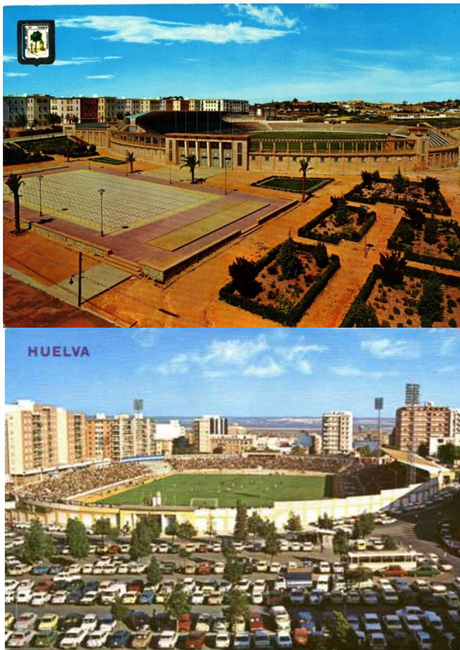
Figura 1. Estadio Municipal frontal y Plaza del Estadio. Trasera y Plaza Houston

En el trabajo de campo se han llevado a cabo entrevistas a comercios circundantes al Estadio cuya antigüedad pudiera hablar de décadas pasadas al abrigo de la actividad del Estadio Colombino, y que le diesen a la muestra una amplia variedad de sectores. Se han entrevistado a comercios reconocidos en el barrio como papelerías, ferreterías, tiendas de calzados, peluquerías, joyerías, etc. 13 Casi todas ellas sin relación directa con el deporte pero sí establecidas junto al Estadio o su zona de influencia desde los 70. El denominador común es el desencanto y la nostalgia. Isla Chica cobra fuerza y status desde los 70, cuando la vida social en la zona tiene auge, encareciéndose el suelo y el alquiler de locales. Pero no sólo comercios surgieron en la zona, asociaciones culturales o “peñas” deportivas filiales del