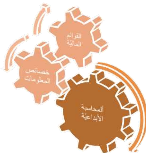
شكل رقم (1) انموذج الدراسة